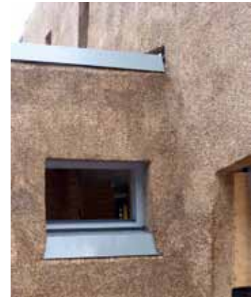
Detail rieten gevel - Woudenberg