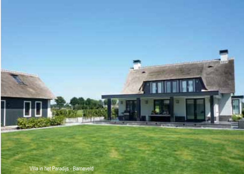
Villa in het Paradijs - Barneveld