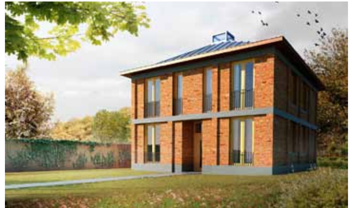
Klassieke villa - Lelystad