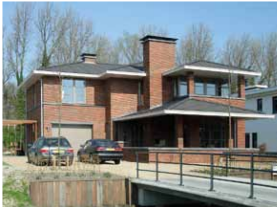
Villa - Hillegersberg