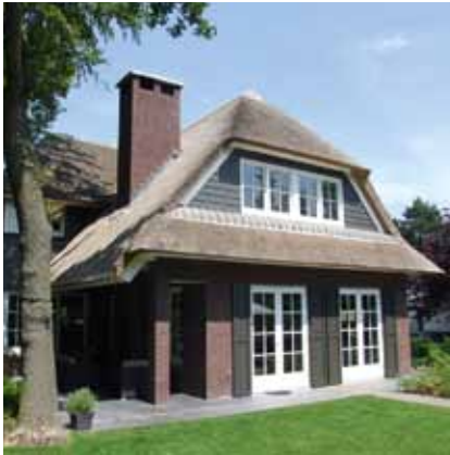
Rietgedekte villa - Blaricum