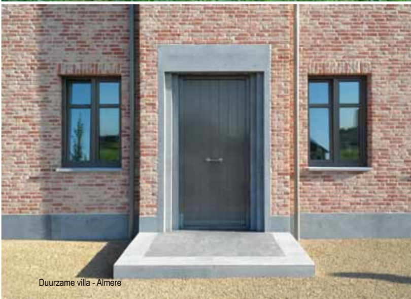
Duurzame villa - Almere