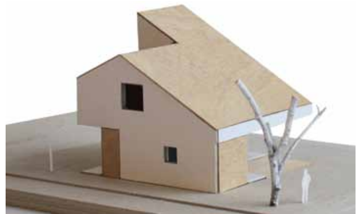
Huis VV - Almere