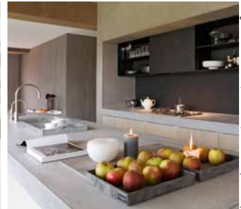
Huis de Wiers - Nieuwegein