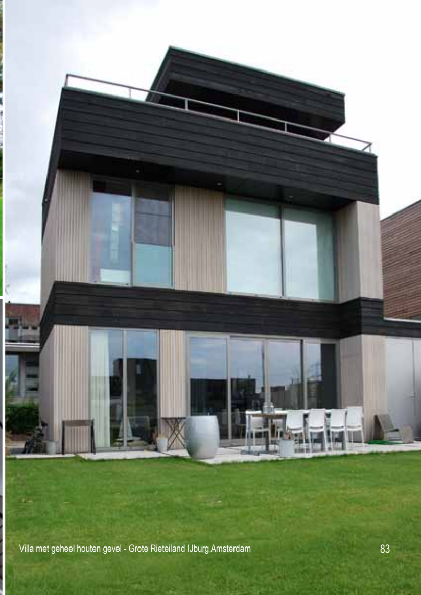
Villa met geheel houten gevel - Grote Rietland IJburg Amsterdam