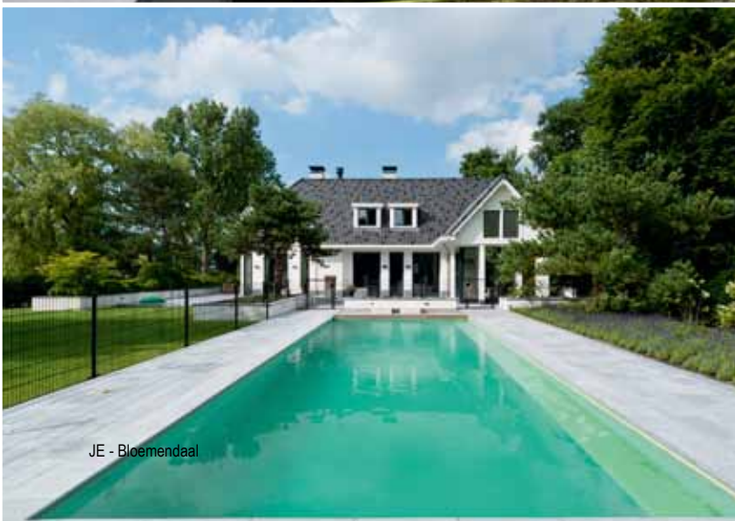
JE - Bloemendaal