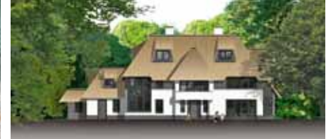
DP - Aerdenhout