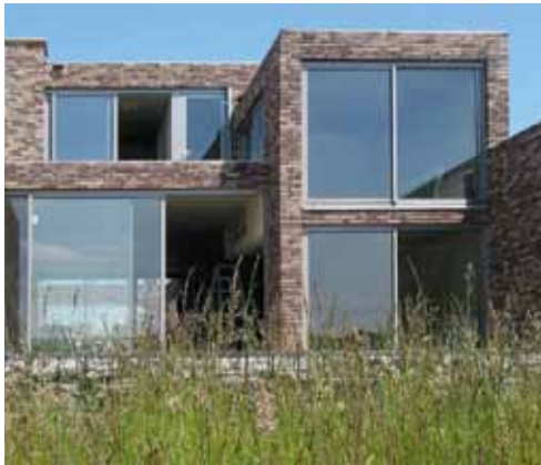
Sculpturaal metselwerk Villa IJburg - Kleine Rieteland Amsterdam