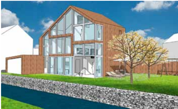
TWEE als EEN - Amsterdam