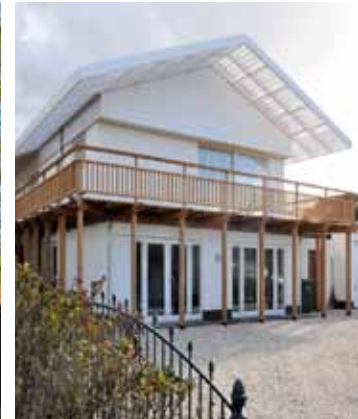
GB22 - Noordwijk aan Zee