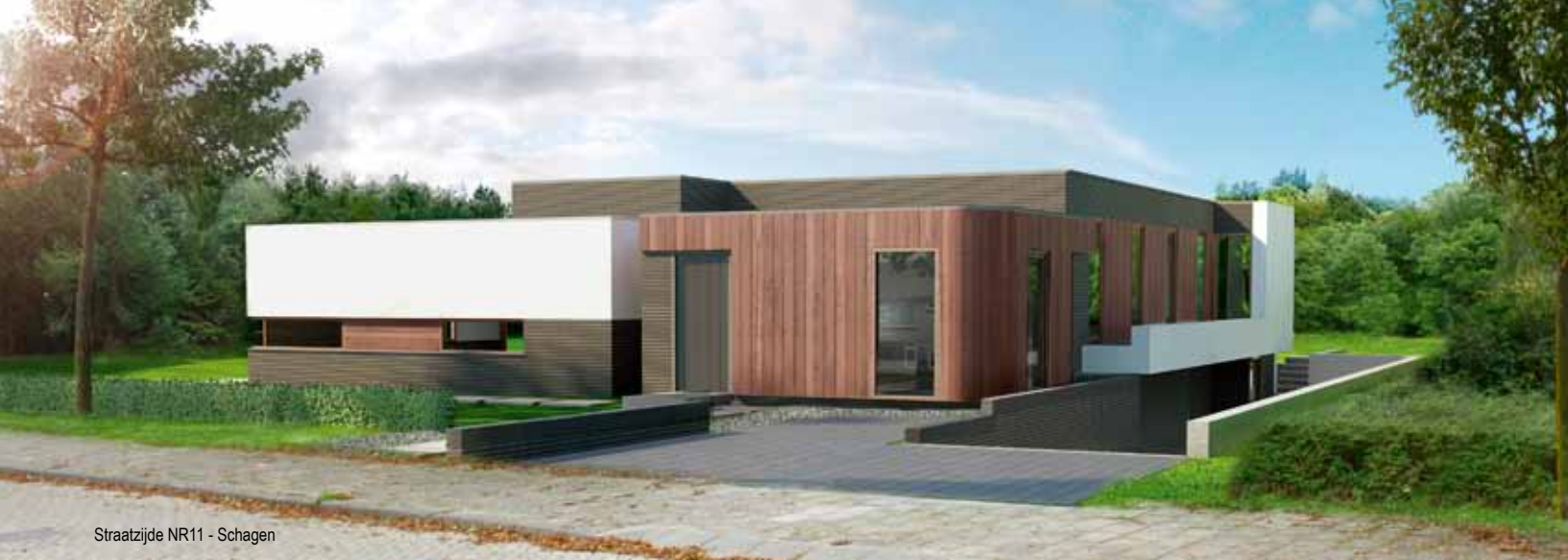
Straatzijde NR11 - Schagen