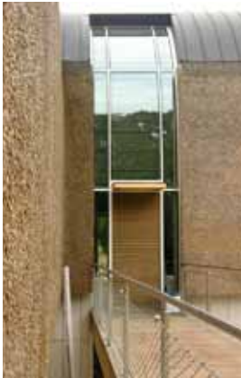
Entree familiehuis - Laren NH