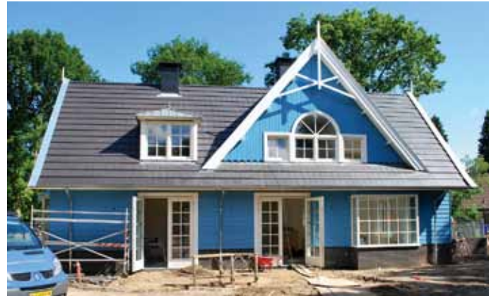
Woonhuis - Blaricum 2007

Fotografie: Architectenburo J.P. Roselaar