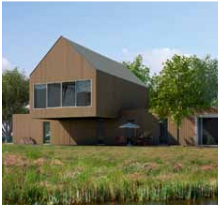
Woning - Blauwestad Groningen