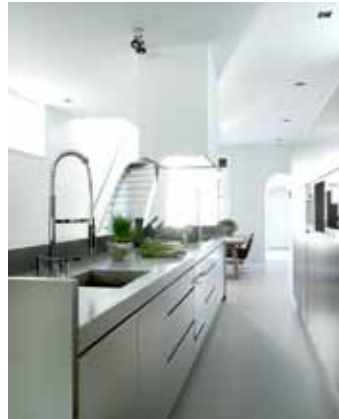
Monumentaal grachtenpand - Utrecht