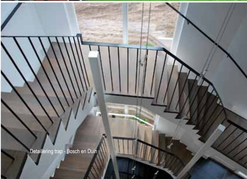
Detailering trap - Bosch en Duin