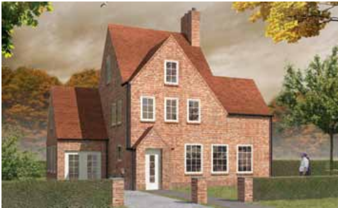
Engelse villa - Hoofddorp