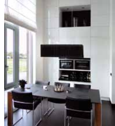
Fotografie en beeld: Design for interiors