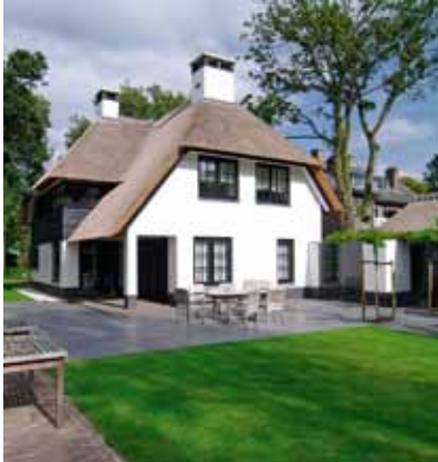
Rieten kap 1