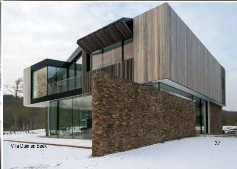
Villa Duin en Beek