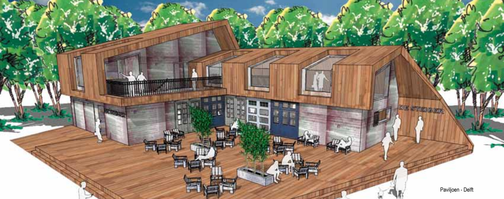
Paviljoen - Delft