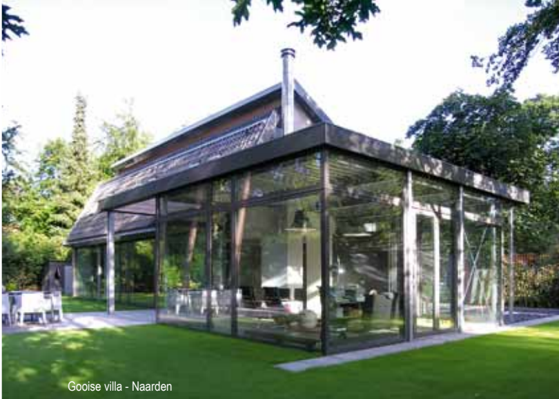
Gooise villa - Naarden