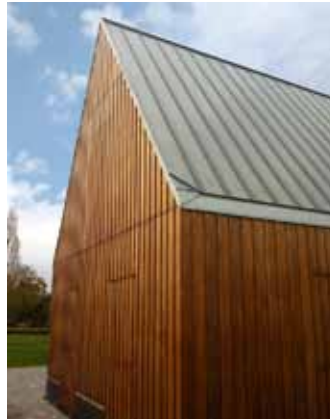
HK05 - Barendrecht