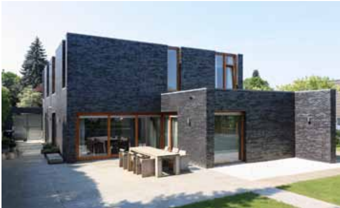
Huis JB - Heerlen