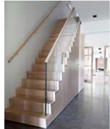
Woonboerderij in 't Groene Hart