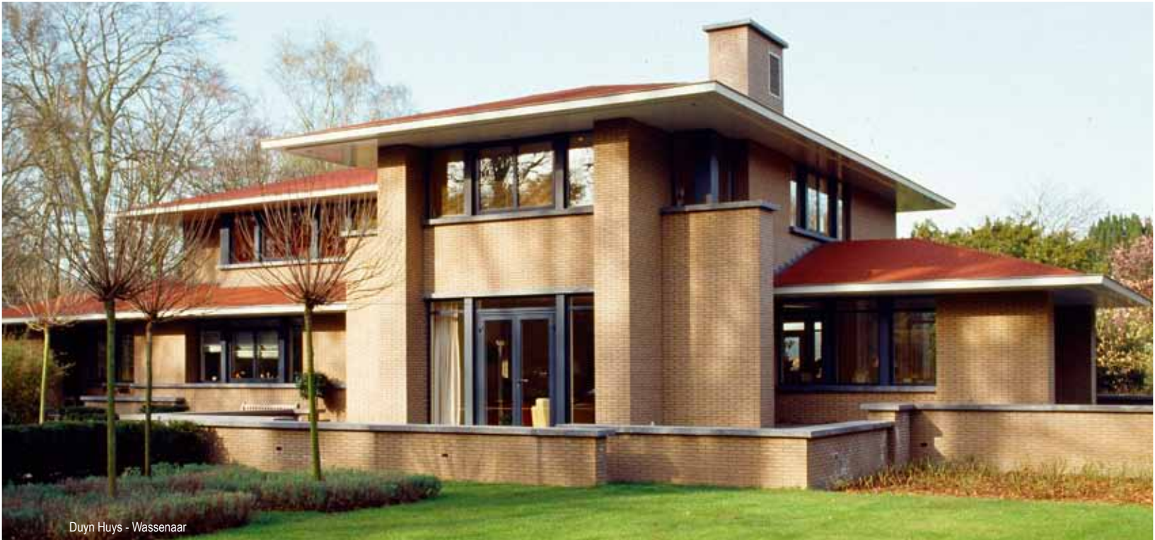
Duyn Huys - Wassenaar