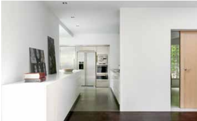
Jaren dertig-villa - Bussum