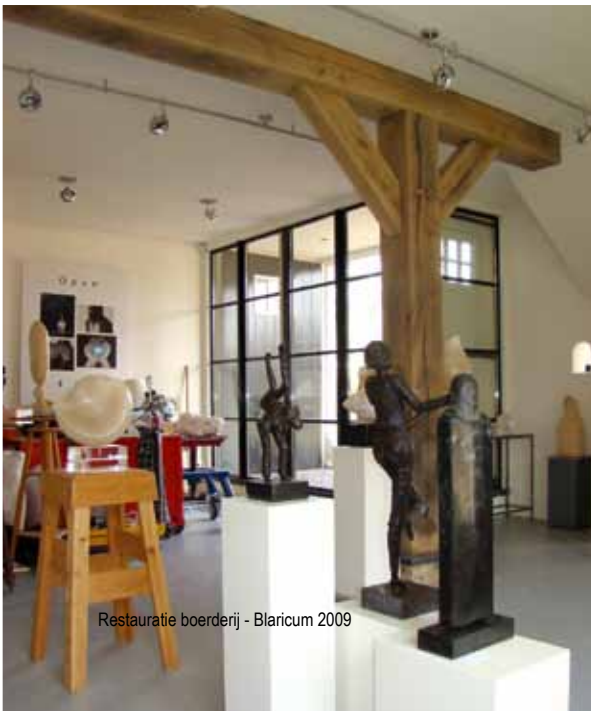
Restauratie boerderij - Blaricum 2009