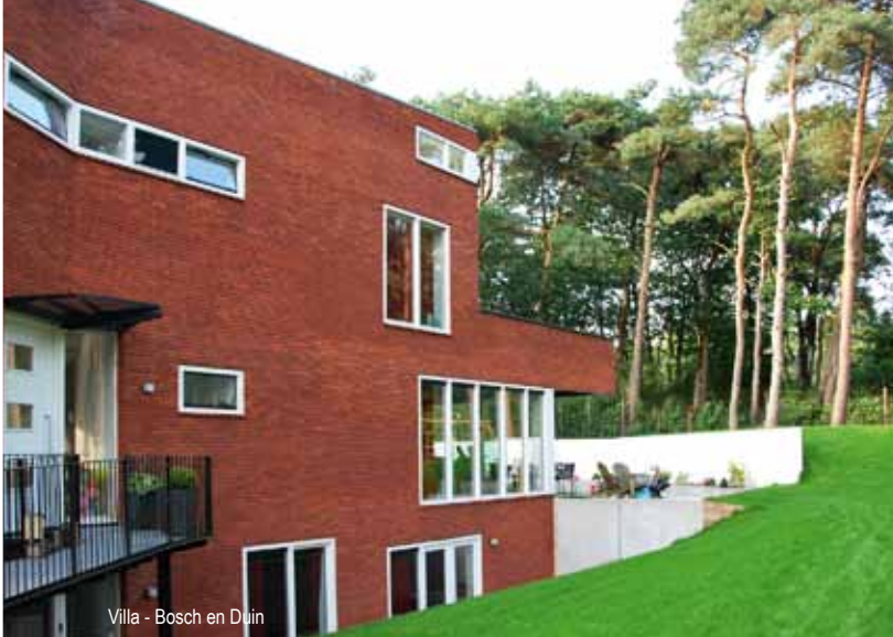
Villa - Bosch en Duin