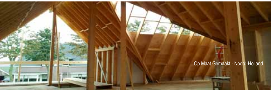
Op Maat Gemaakt - Noord-Holland