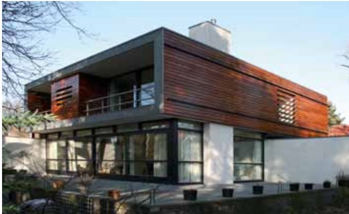
Dwergspar - Bennebroek