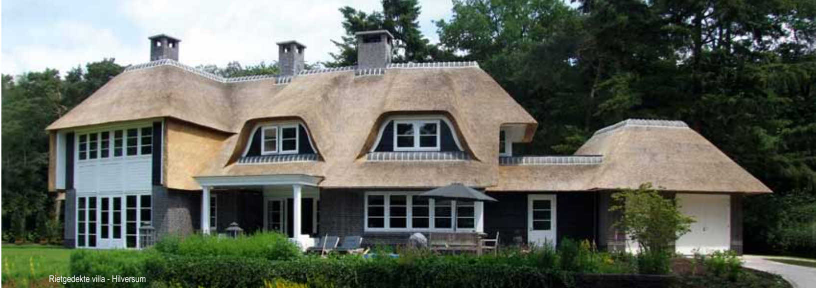
Rietgedekte villa - Hilversum