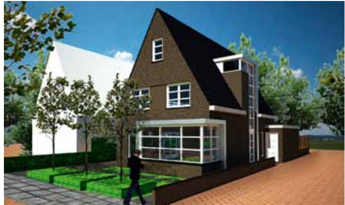
Fotografie en beeld: VEDD Architecten bna