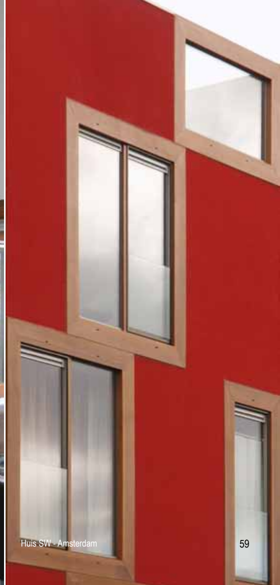
Huis SW - Amsterdam