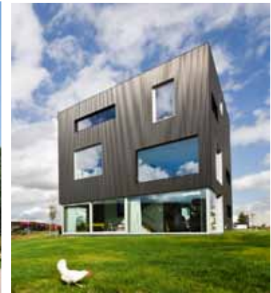
LOFTHOME kubus - Leidsche Rijn