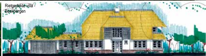
Rietgedekte villa - Beekbergen