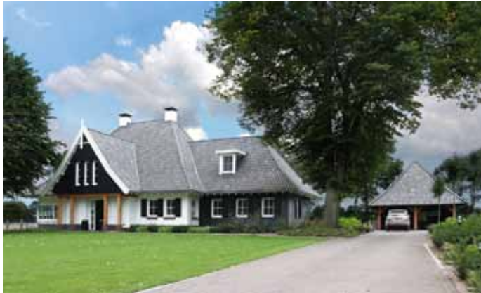
Landhuis - Wierden