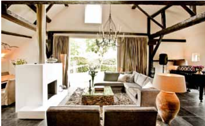
Woonboerderij - Blaricum