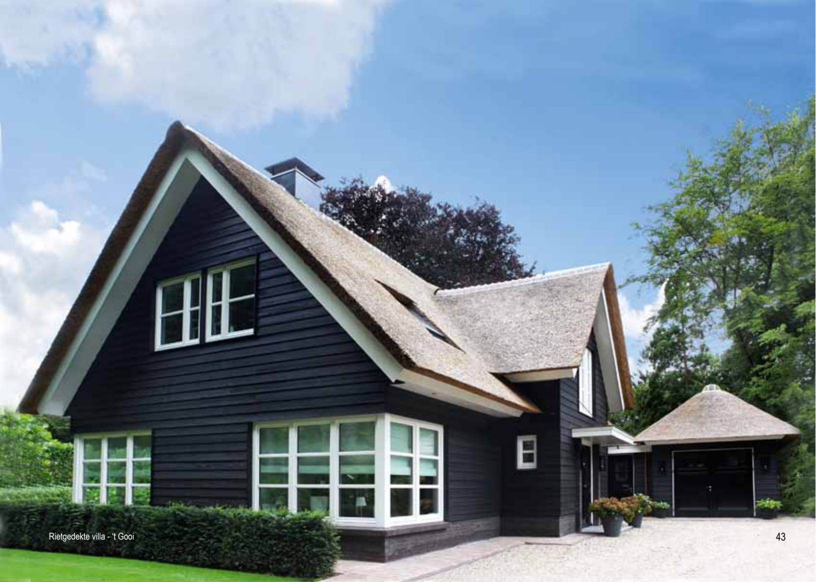
Rietgedekte villa - 't Gooi