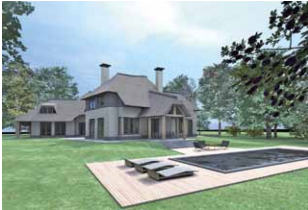
JK - Aerdenhout