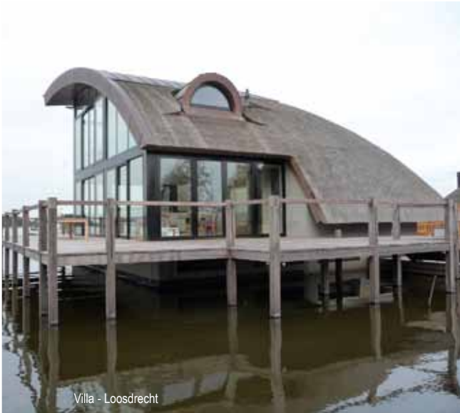
Villa - Loosdrecht