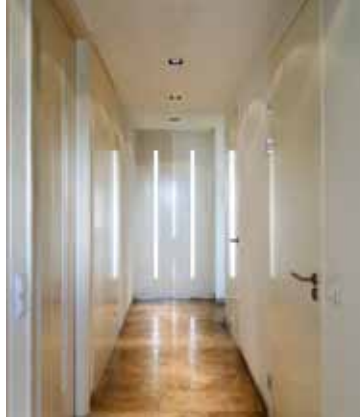
Herenhuis - Amersfoort