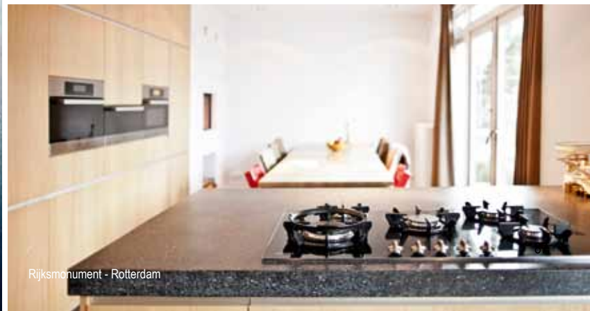
Rijksmonument - Rotterdam