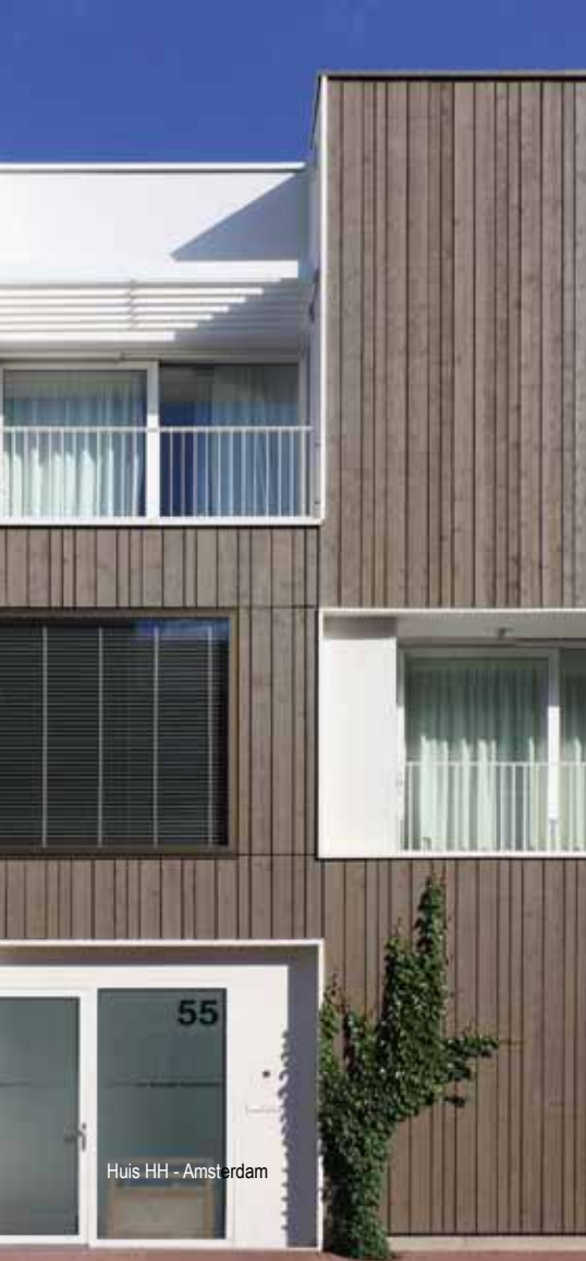
Huis HH - Amsterdam