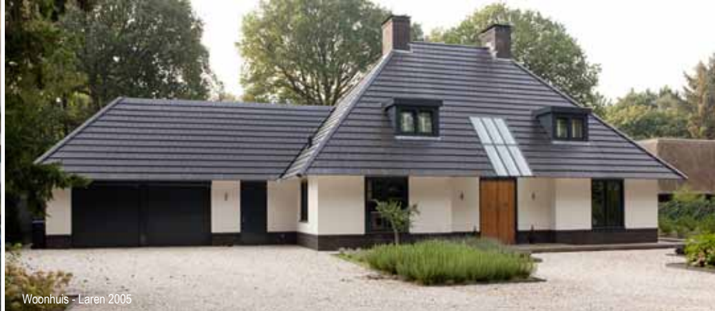
Woonhuis - Laren 2005