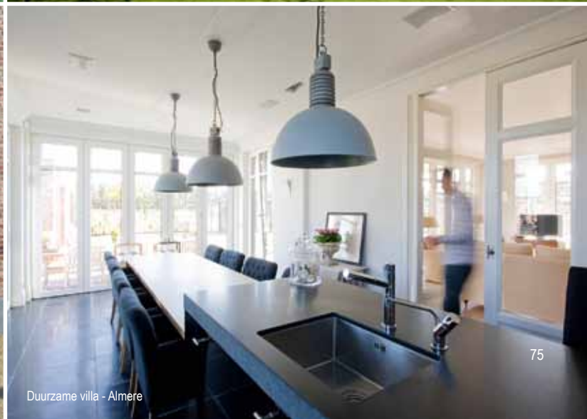
Duurzame villa - Almere