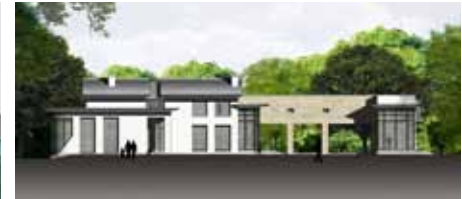
CvA - Rotterdam