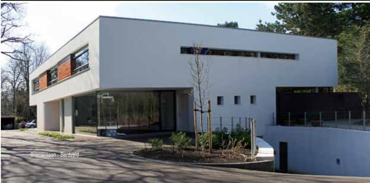
Bramenlaan - Bentveld