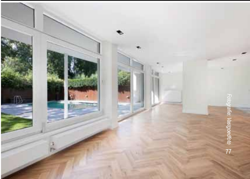
Villa Reimersbeek - Buitenveldert Amsterdam