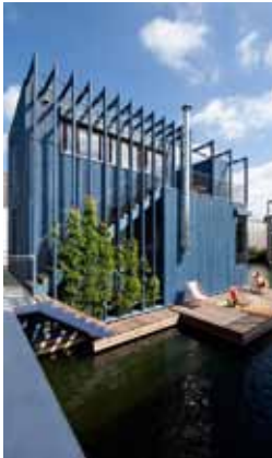
Waterwoning - Amsterdam