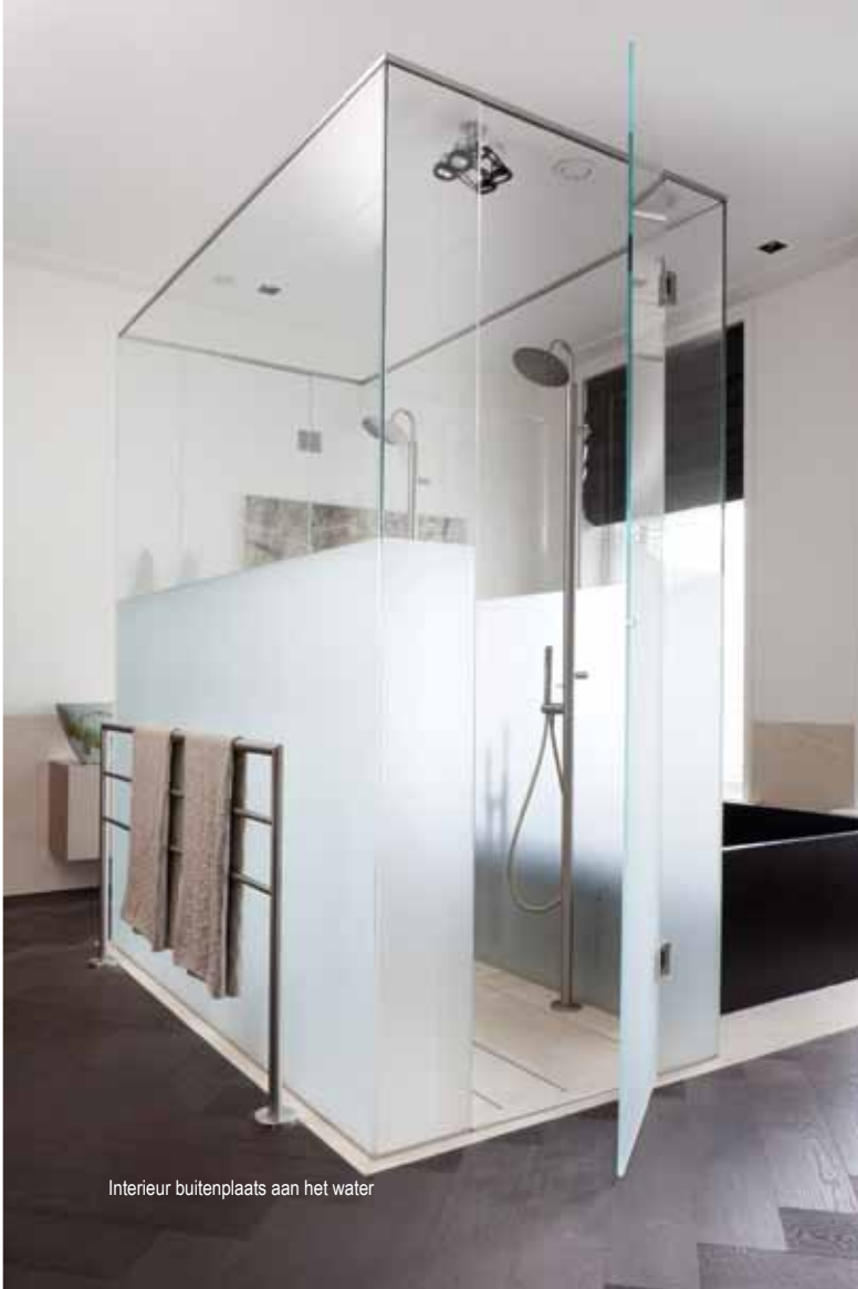
Interieur buitenplaats aan het water