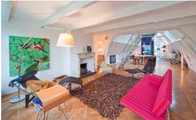
Loft Amstelveld - Amsterdam