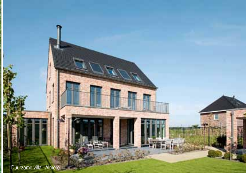
Duurzame villa - Almere