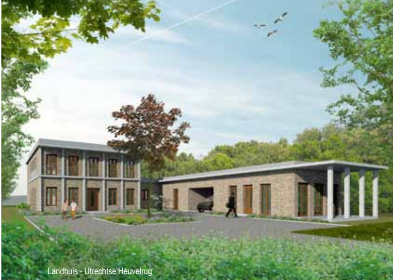
Landhuis - Utrechtse Heuvelrug