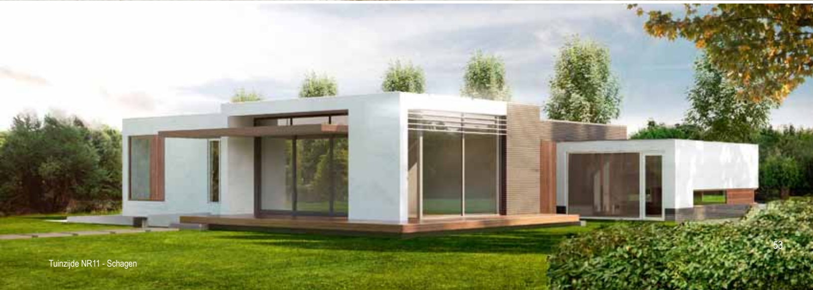
Tuinzijde NR11 - Schagen