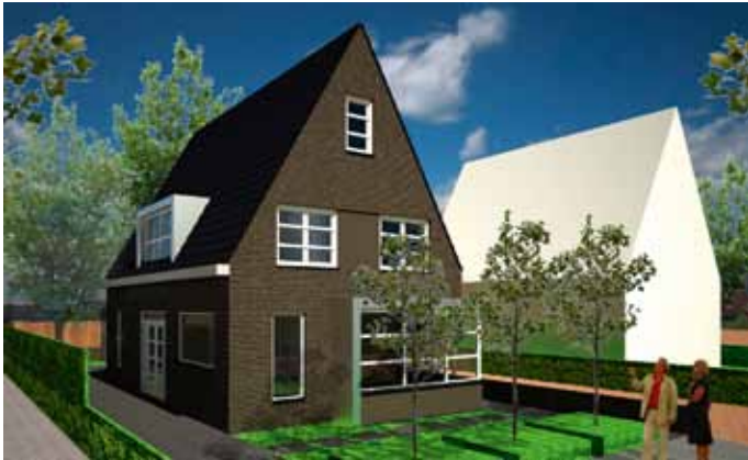
Woning - Zuidoostbeemster