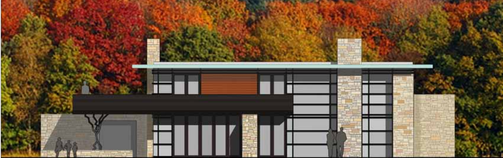
Swartsenburgerlaan - Bennebroek