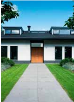
Villa Johan de Wit - Barneveld