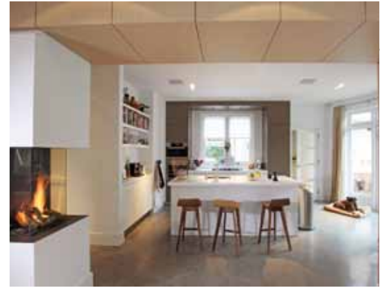
Villa - Bloemendaal