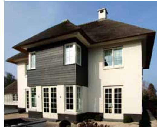
Rietgedekte villa - Reeuwijk