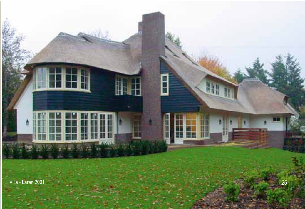
Villa - Laren 2001