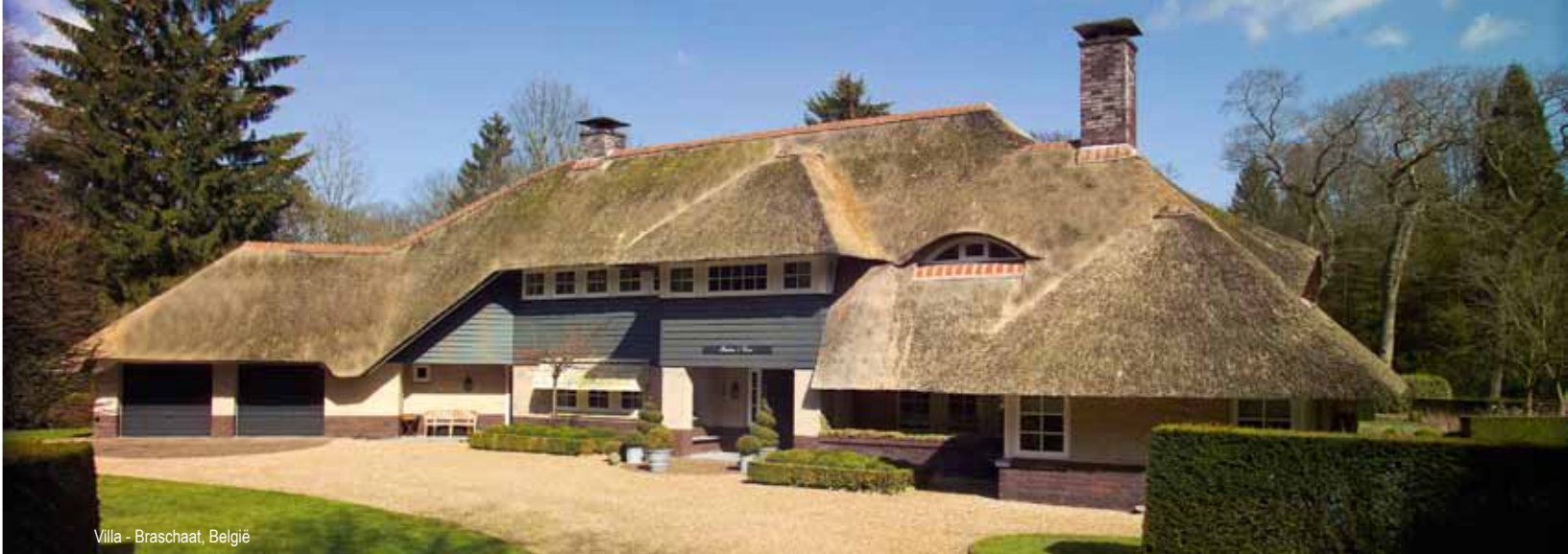
Villa - Braschaat, België