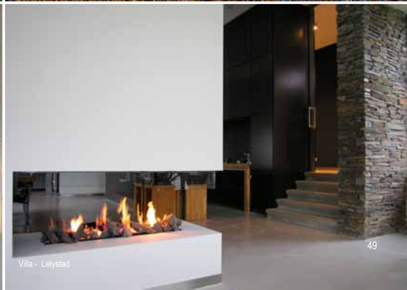
Villa - Lelystad