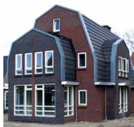
Moderne villa - Utrecht