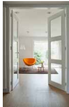
Villa - Naarden