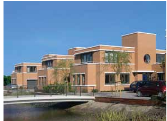
Villa - Hillegersberg

Fotografie: Peter Kooljman, PBV architecten