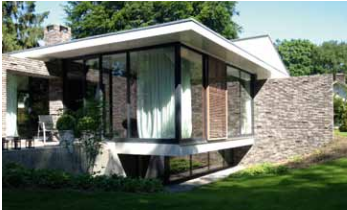
Villa - Laren 2011