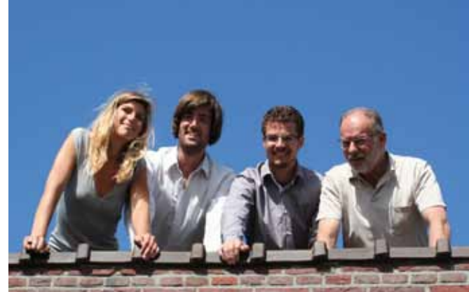
Fotografie en beeld: Noorlag + Partners Architecten