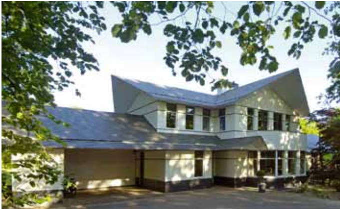
Woonhuis - Velp