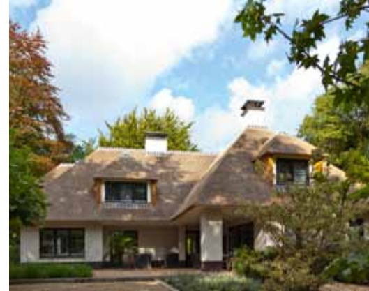
Rieten kap 2