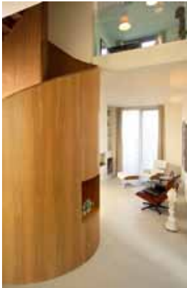
Villa - Loenen