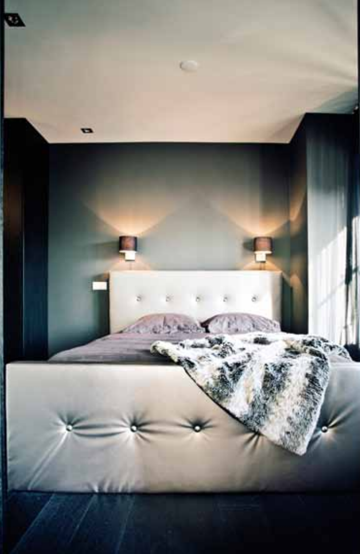
Loft aan de Amstel - Amsterdam