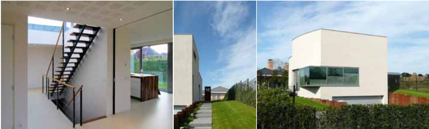
Duinvilla - Vroondaal