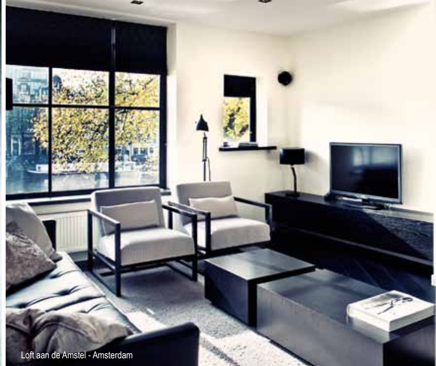
Loft aan de Amstel - Amsterdam