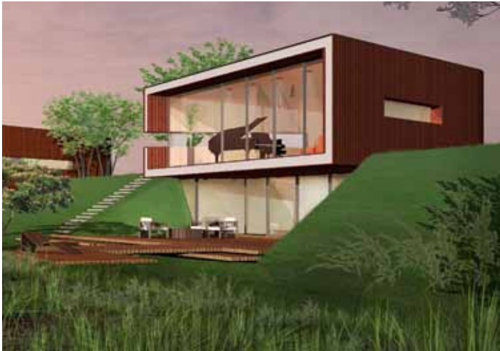
Villa's Goejanverweldijk - Gouda