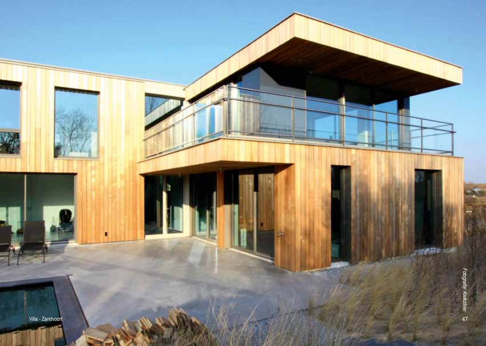
Villa - Zandvoort