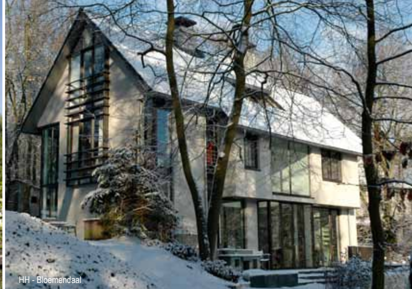
HH - Bloemendaal