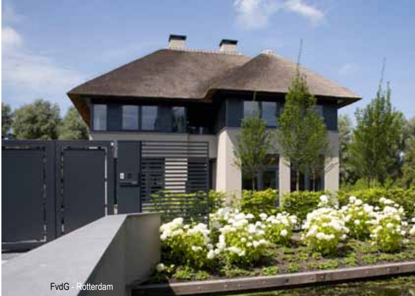
FvdG - Rotterdam