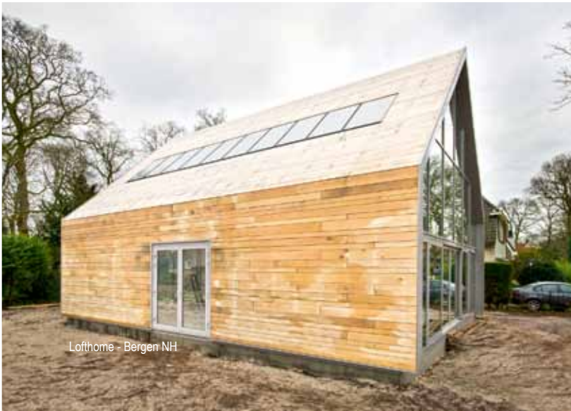
Lofthome - Bergen NH