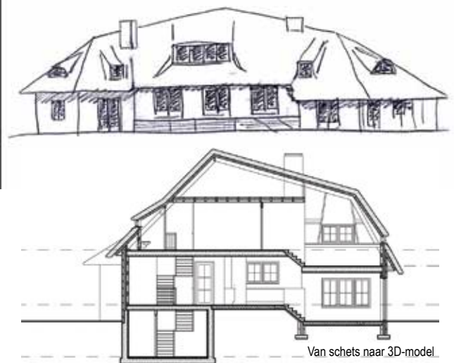
Van schets naar 3D-model