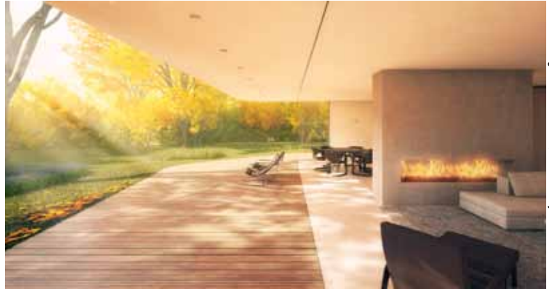
Fotografie: ASSTUDIO, Hofman Dujardin Architecten