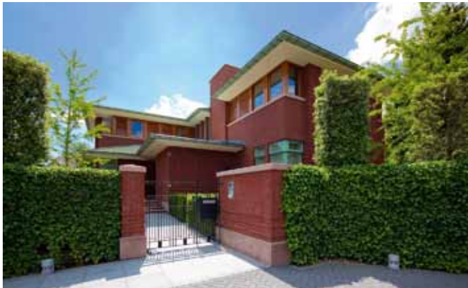
Villa - Laren (Noord-Holland)