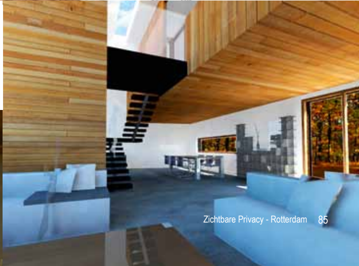
Zichtbare Privacy - Rotterdam