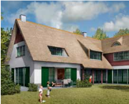
Villa - Hilversum