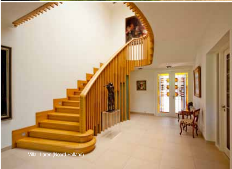
Villa - Laren (Noord-Holland)