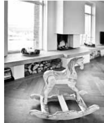
Nieuwbouw jarendertigvilla, modern landelijk