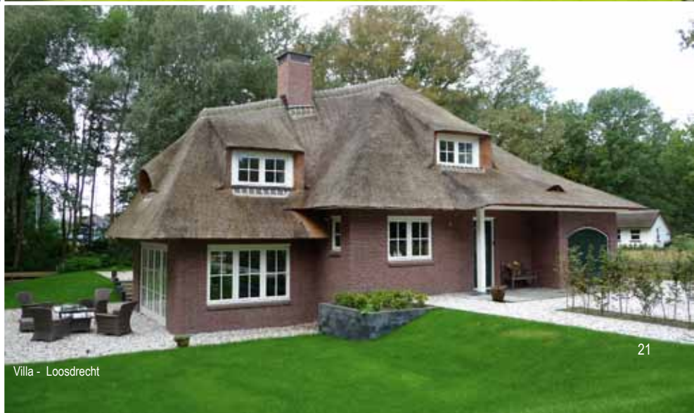
Villa - Loosdrecht