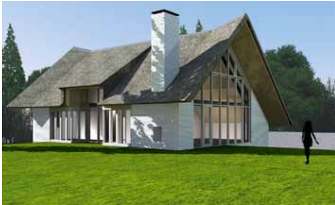
Villa met rieten kap - 't Gooi