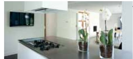
Fotografie: BOXXIS Architecten