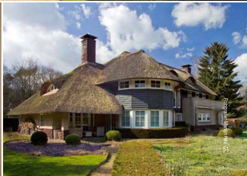
Fotografie: Marlijn Heil, 55