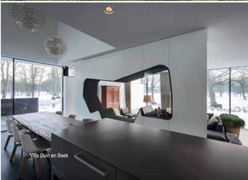
Villa Duin en Beek