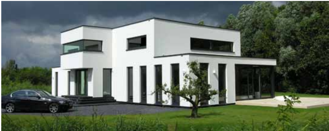
Moderne villa in de Noordzoom - Lelystad