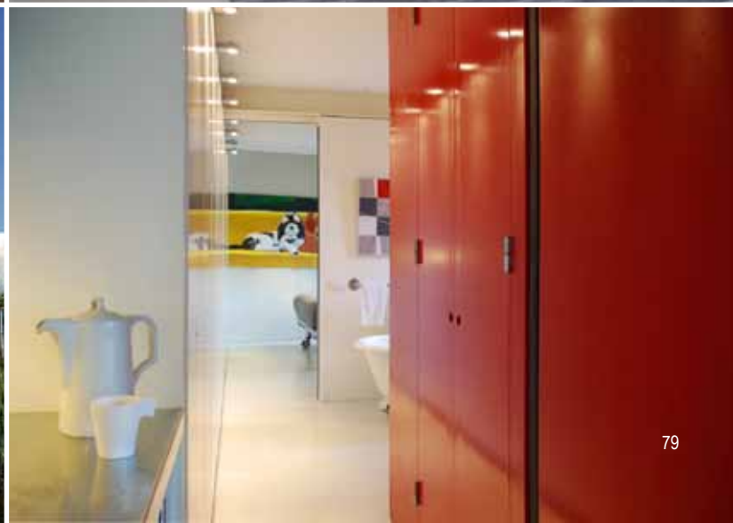
Woonwerkwoning - IJburg Amsterdam