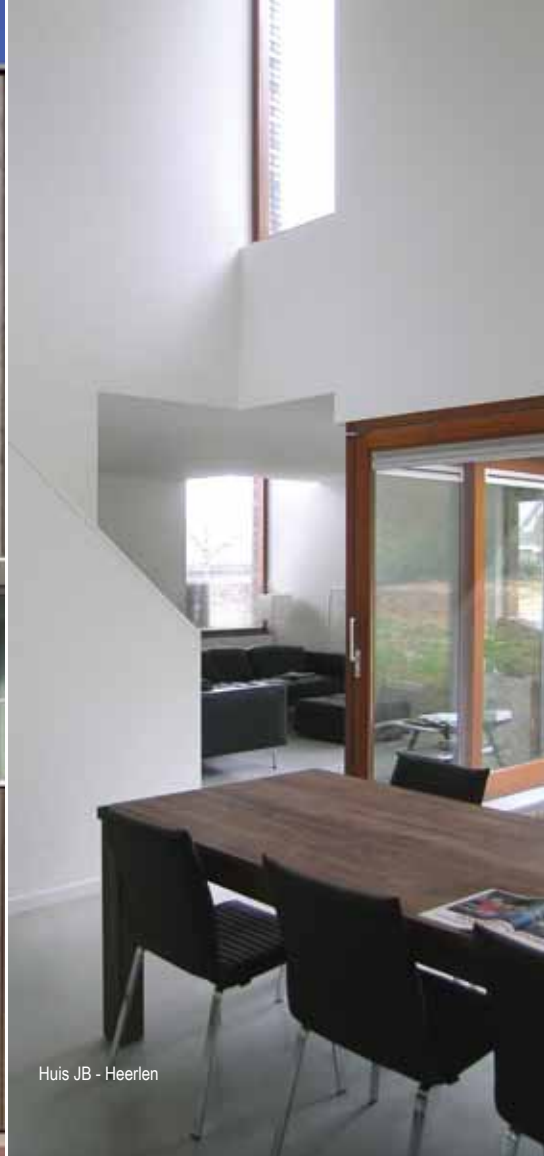
Huis JB - Heerlen