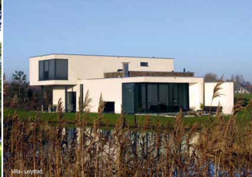
Villa - Lelystad