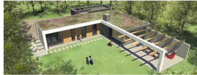
Huis Hille - Oudorp