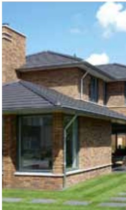
Villa - Woerden