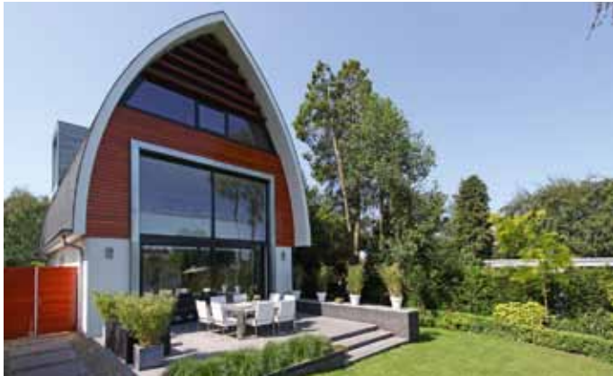
Villa U Extérieur - Ede