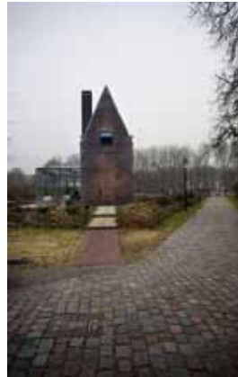
Schootshuis - Fort Blauwkapel