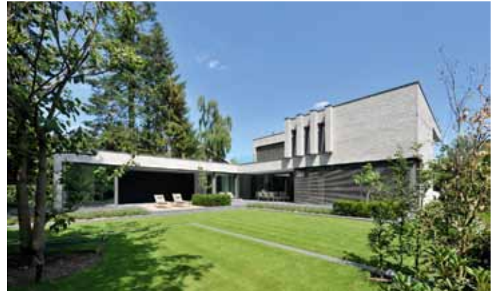
Villa V Extérieur - Breda