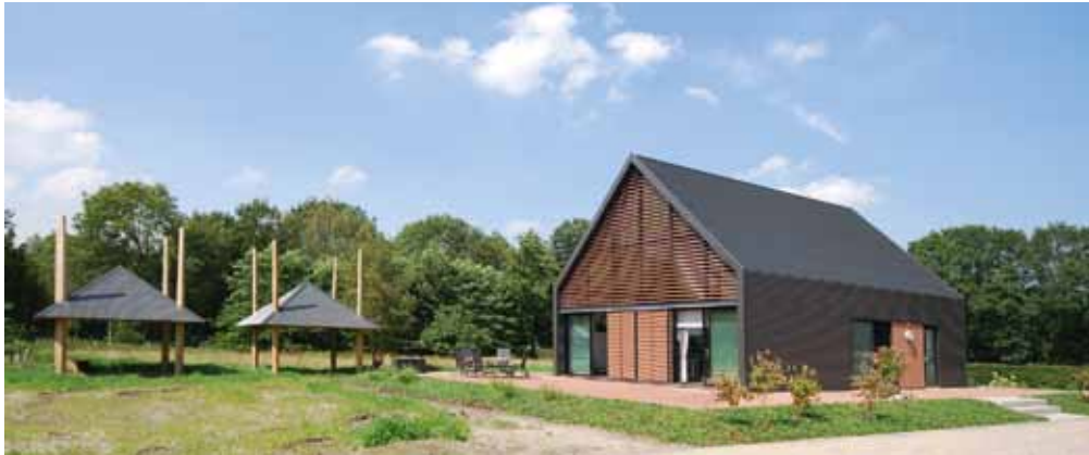
LOFTHOME zadeldak - Veenendaal