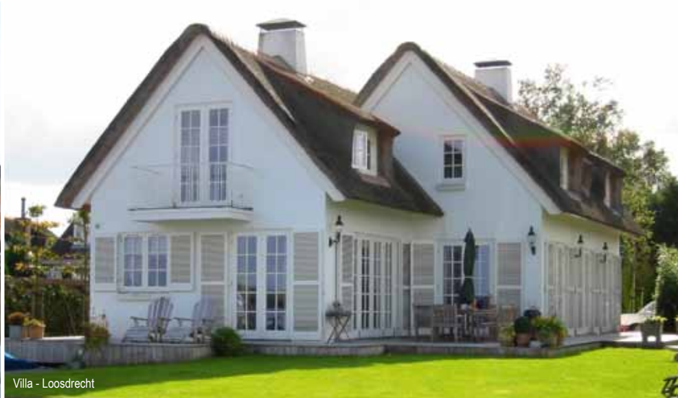
Villa - Loosdrecht