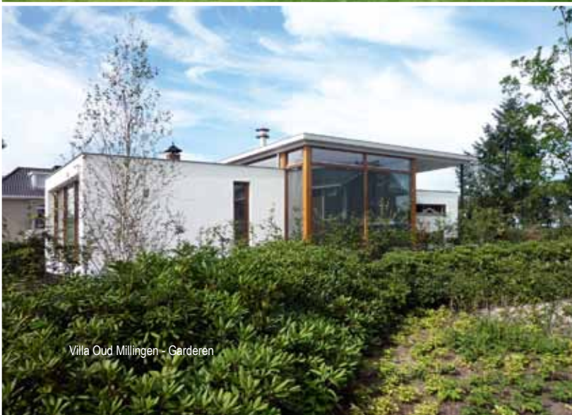
Villa Oud Millingen - Garderen