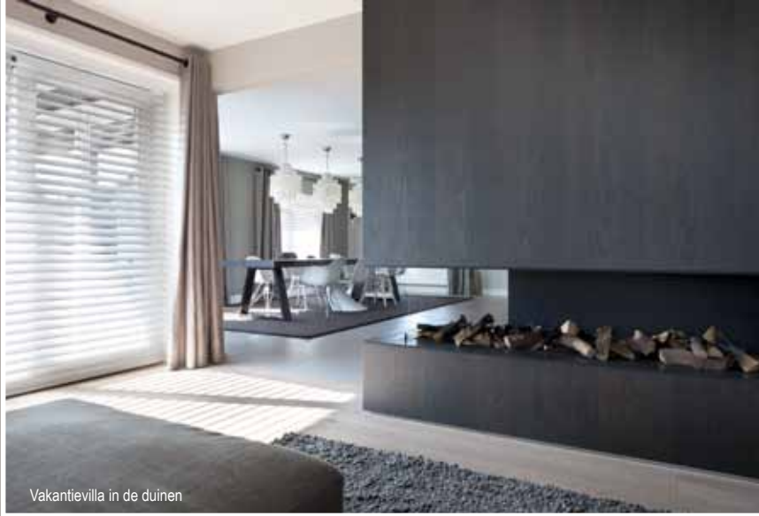
Vakantievilla in de duinen