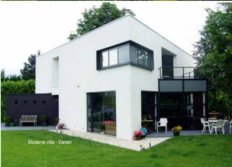
Moderne villa - Vianen