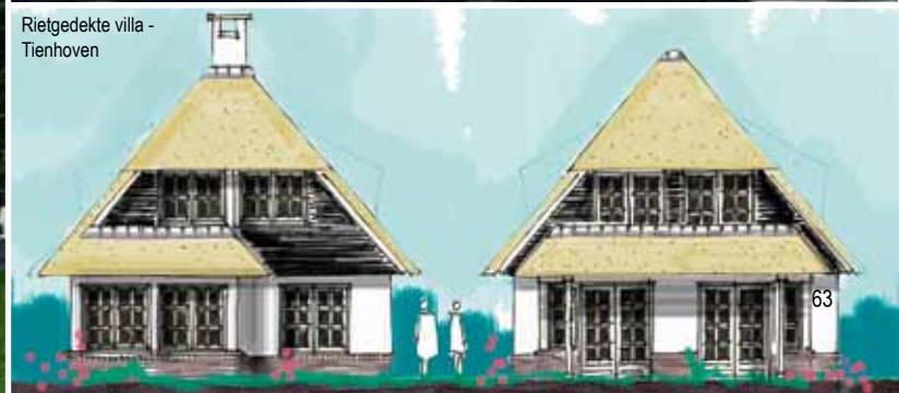
Rietgedekte villa - Tienhoven