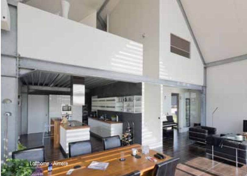
Lofthome - Almere