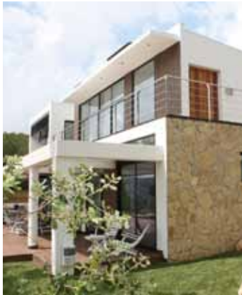
PF17 - Calonge, Spanje