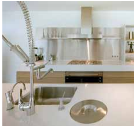
Woning - Harmelen