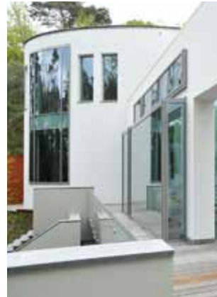
KB - Bosch en Duin