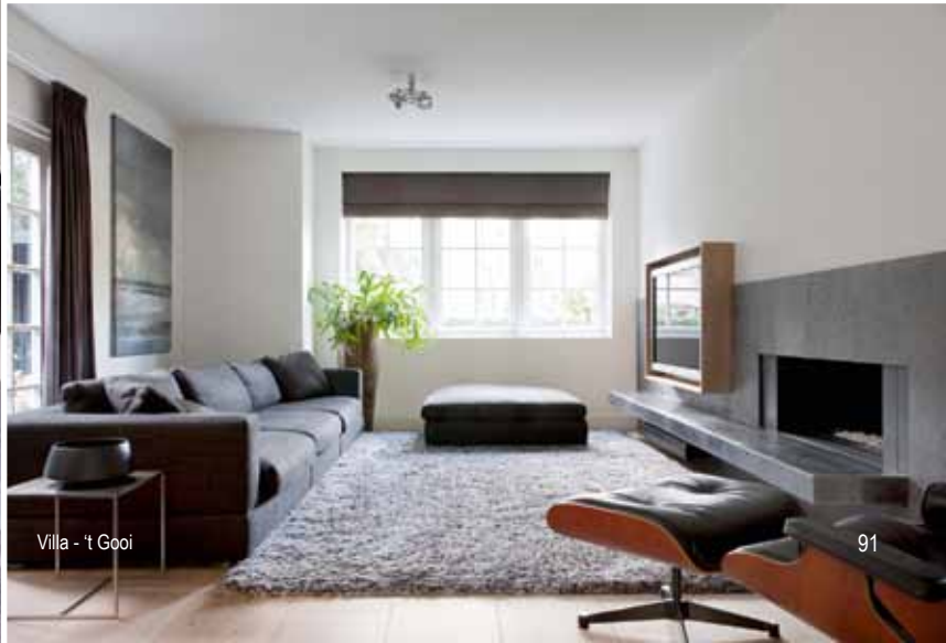
Villa - 't Gooi