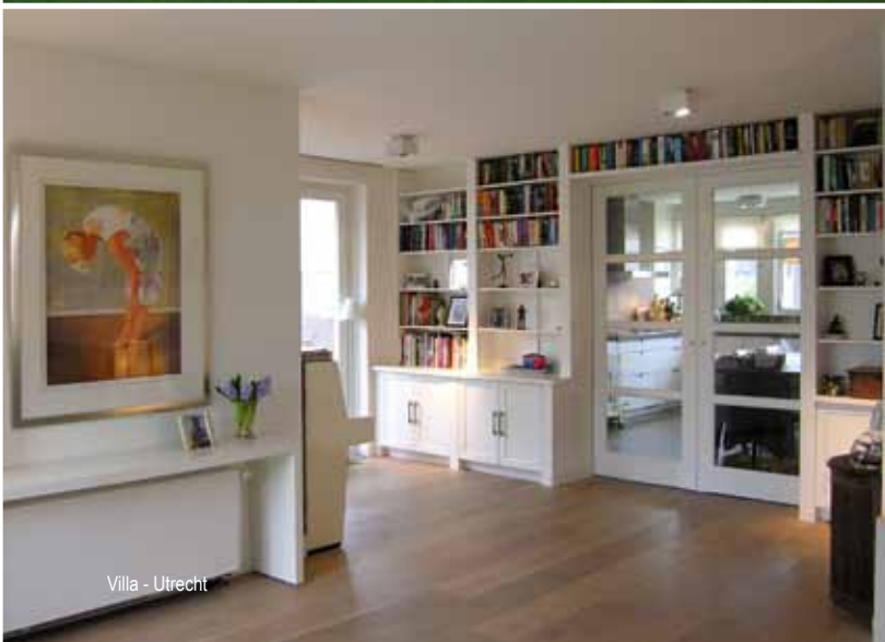
Villa - Utrecht