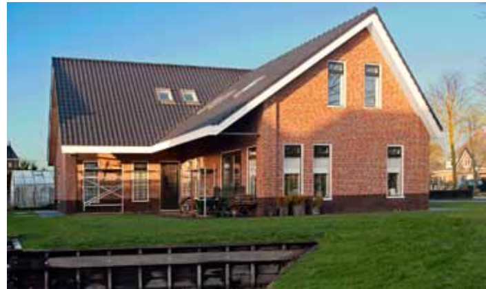
Op Maat Gemaakt - Noord-Holland