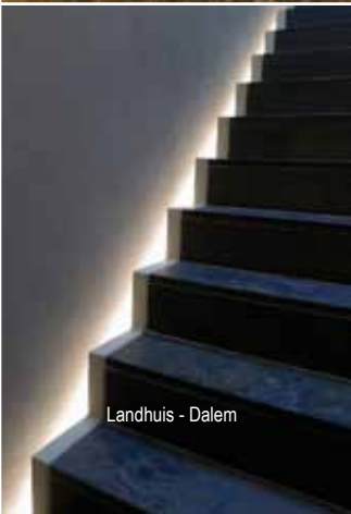
Landhuis - Dalem