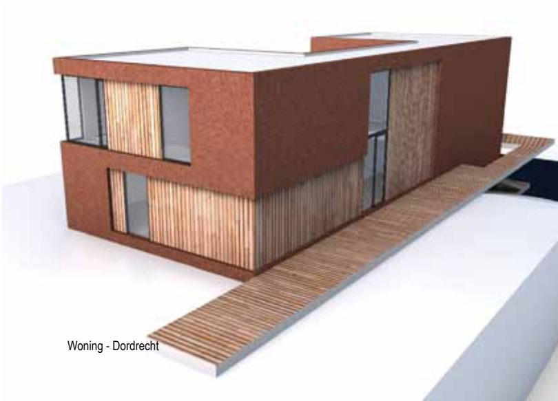
Woning - Dordrecht