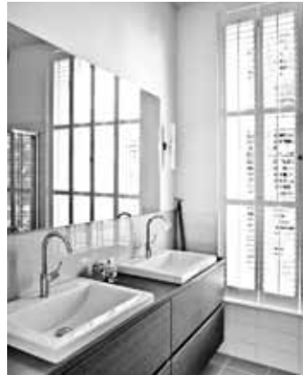
Rijksmonument - Rotterdam