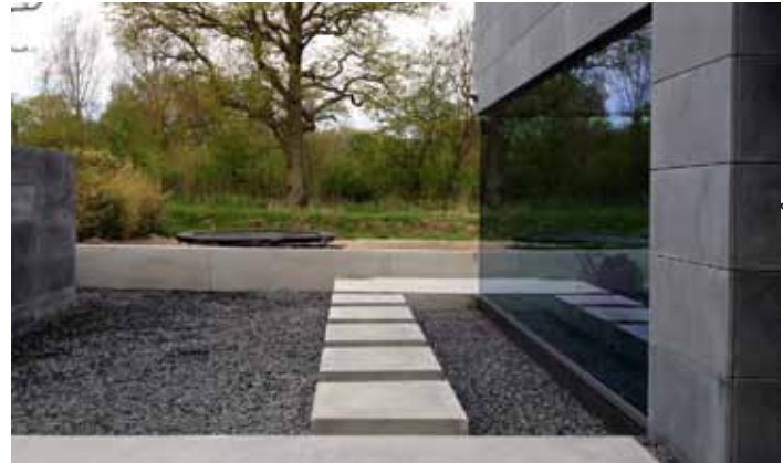
Fotografie en beeld: studio architecture