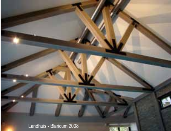
Landhuis - Blaricum 2008