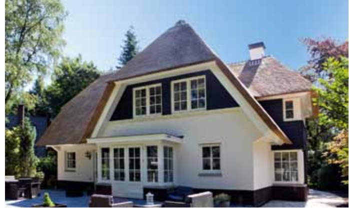
Rietgedekte villa - Apeldoorn