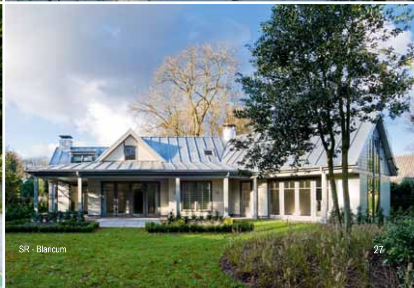
SR - Blaricum