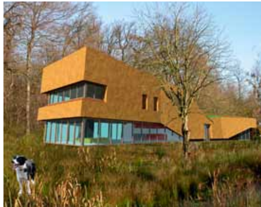
Ontwerpschets landelijke villa - Woudenberg