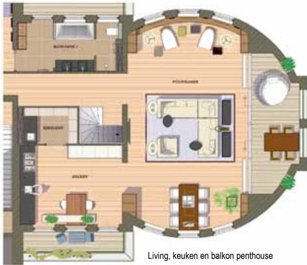
Living, keuken en balkon penthouse