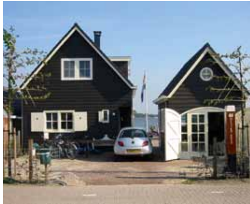
Woonhuis - Loosrecht