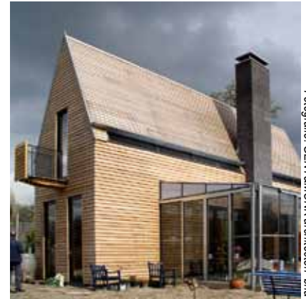
Schootshuis - Fort Blauwkapel