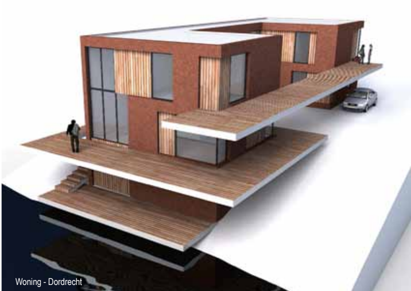
Woning - Dordrecht