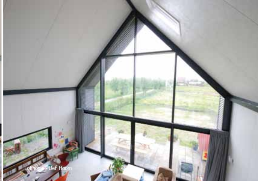
Lofthome - Den Hoorn