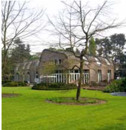
Familiehuis - Laren NH