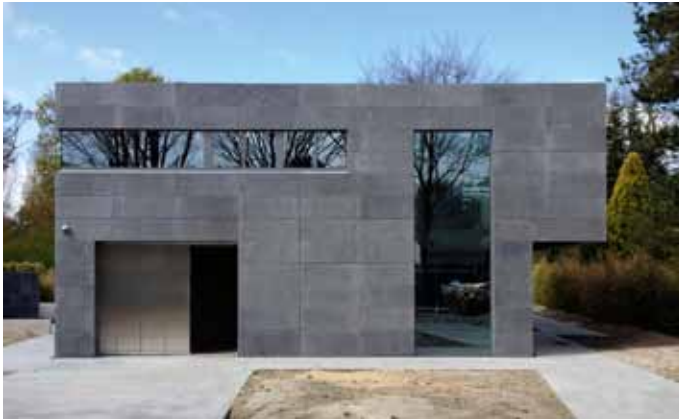
Woning - Oostvoorne