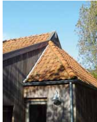
SB06 - Warffum