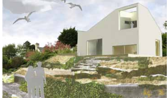
Villa op het duin - Hoek van Holland