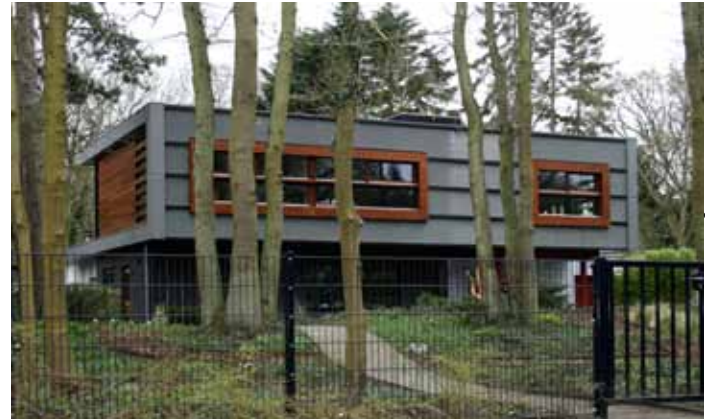
Juliana van Stolberglaan - Aerdenhout