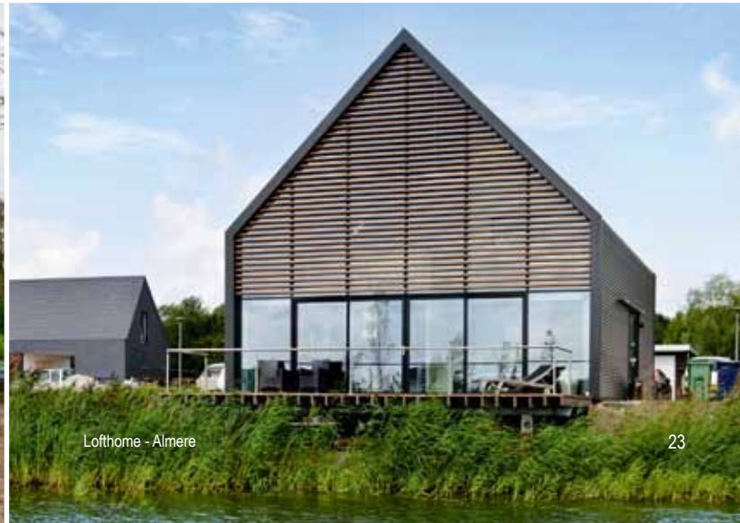
Lofthome - Almere