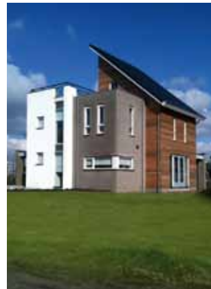
V99.391 - Emmeloord