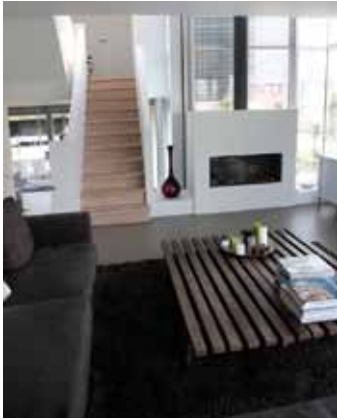
Villa - Apeldoorn