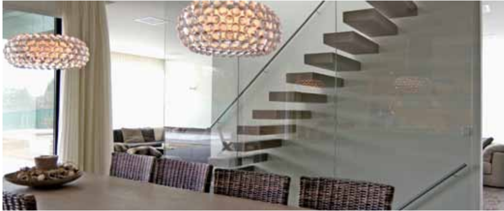
Villa - Meerssen