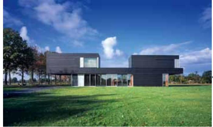
Landschapsvilla - Vriezenveen