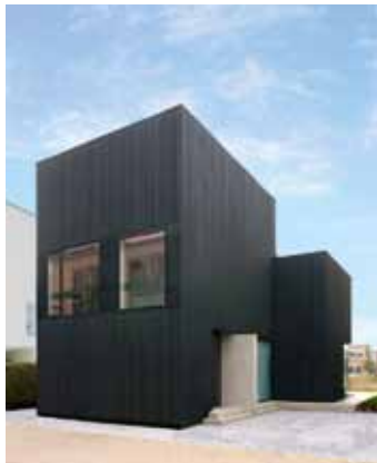
Villa Mattenbiesstraat - IJburg, Amsterdam