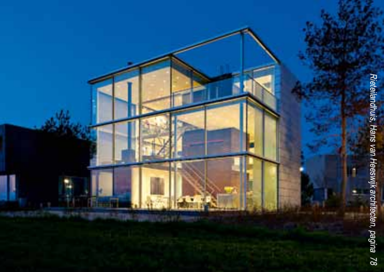
Rietelandhuis, Hans van Heeswijk architecten, pagina 78