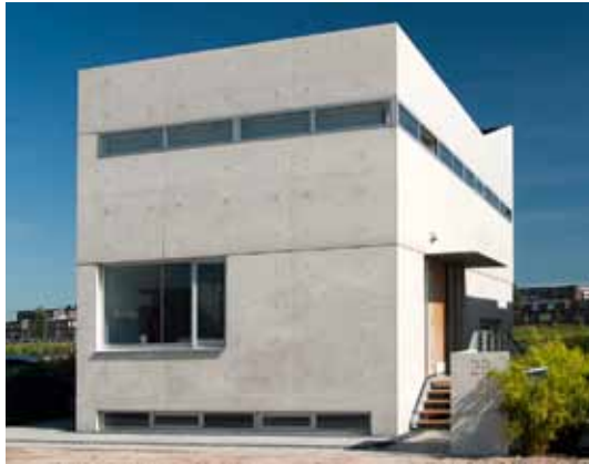
Woonhuis - Rietveld Oost, IJburg, Amsterdam