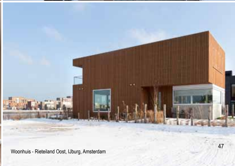
Woonhuis - Rieteland Oost, IJburg, Amsterdam