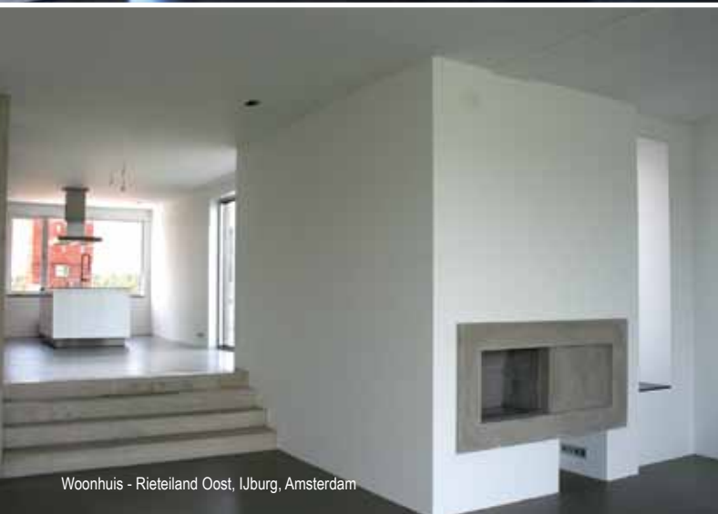
Woonhuis - Rietveld Oost, IJburg, Amsterdam