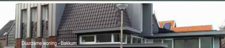
Duurzame woning - Bakkum