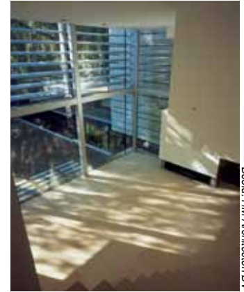
Beeld: HM Architecten BV