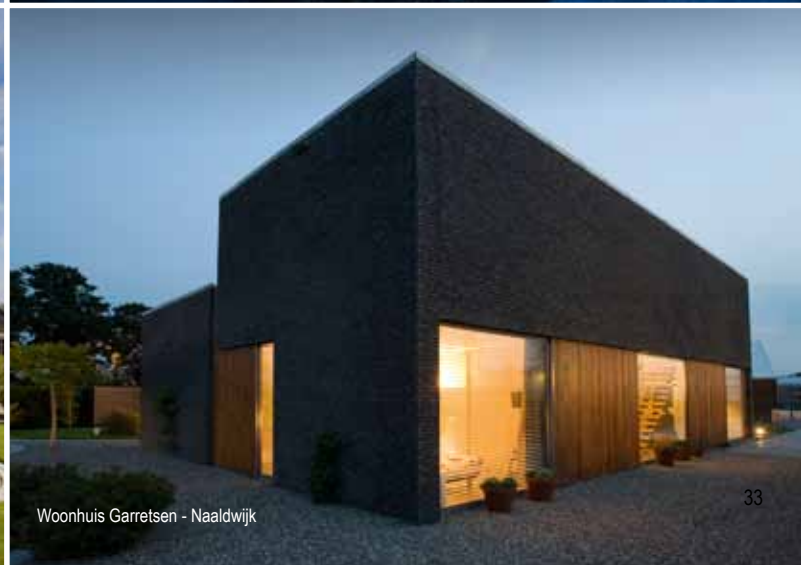
Woonhuis Garretsen - Naaldwijk