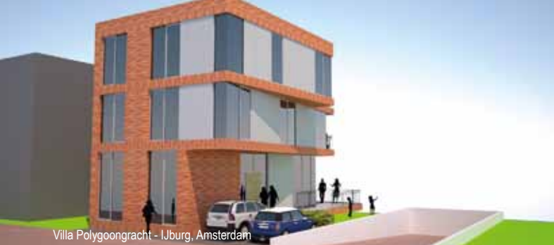
Villa Polygoongracht - IJburg, Amsterdam