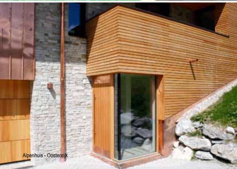
Alpenhuis - Oostenrijk