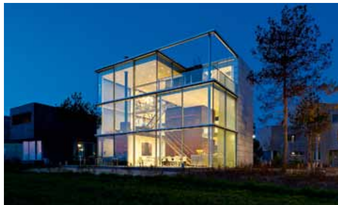
Rieteilandhuis, Hans van Heeswijk architecten - Rieteiland Oost, Amsterdam