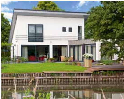
V99.350 - Bunnik