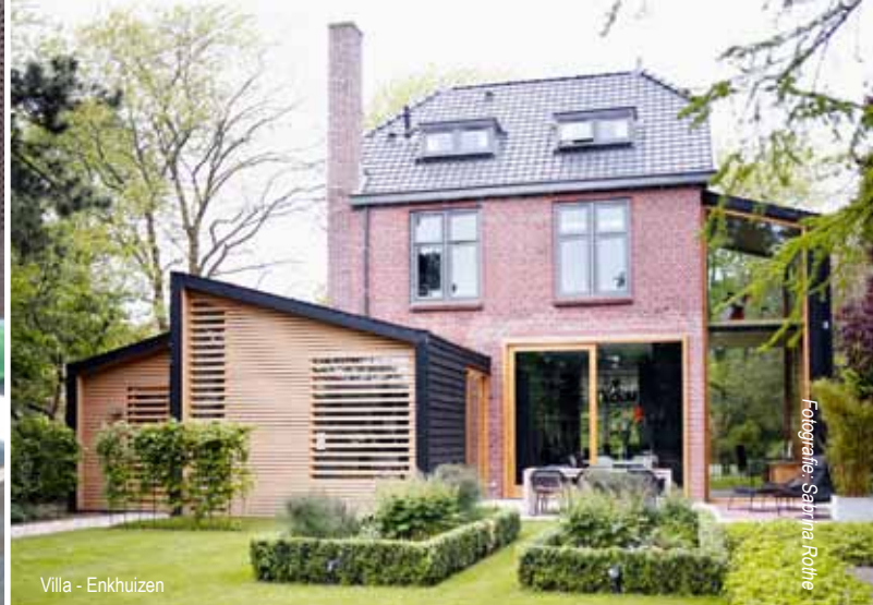
Villa - Enkhuizen