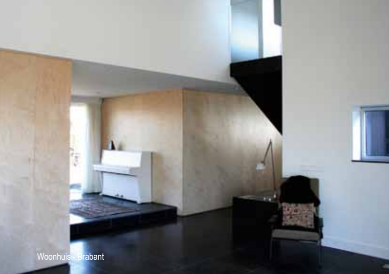
Woonhuis - Brabant