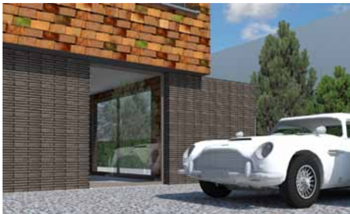
Longhouse, vrijstaande villa