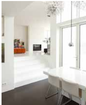
Villa - Rieteiland Oost, IJburg, Amsterdam