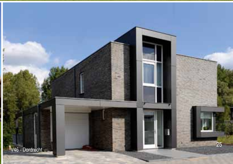
V46 - Dordrecht