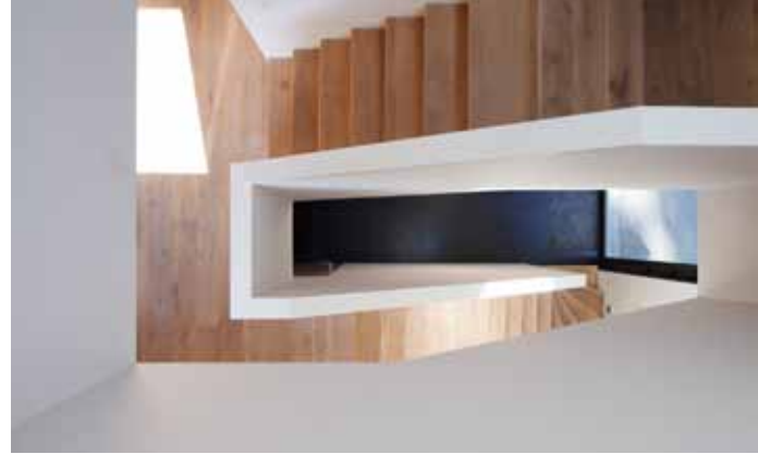
Woning Francois (volledig energieneutraal)