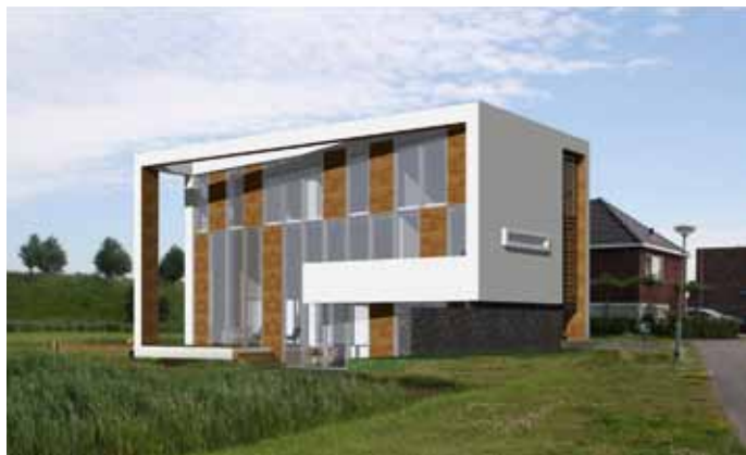
Woning - Goes