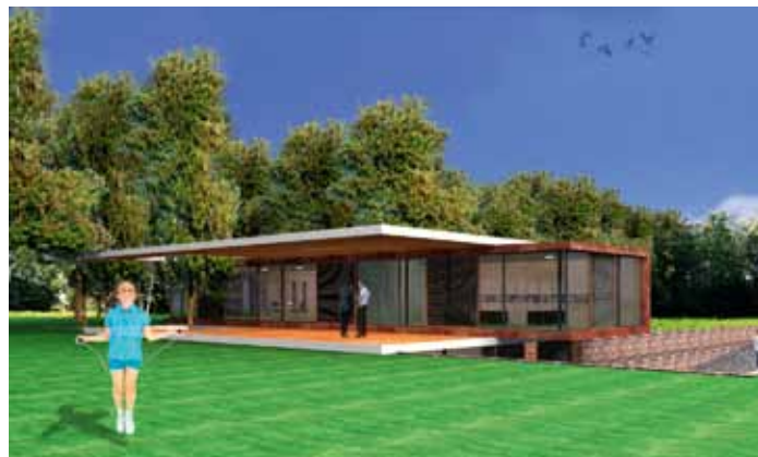
Woning - Haagwijk