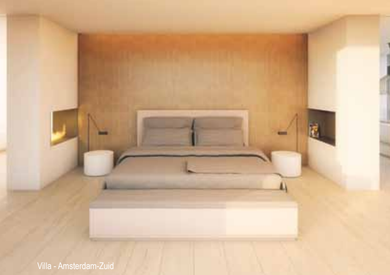
Villa - Amsterdam-Zuid