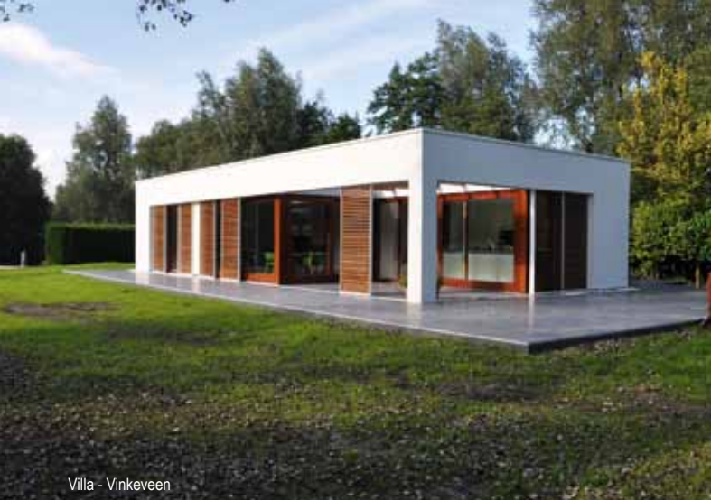
Villa - Vinkeveen