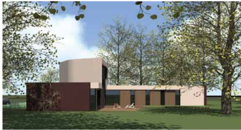
Villa - Abcoude