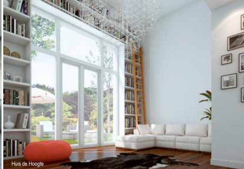
Huis de Hoogte