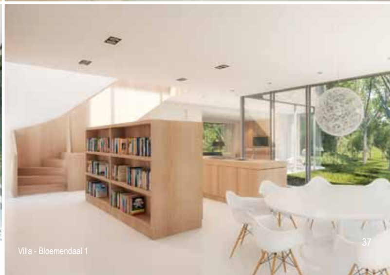
Villa - Bloemendaal 1