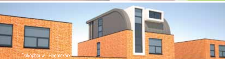
Dakopbouw - Heemskerk