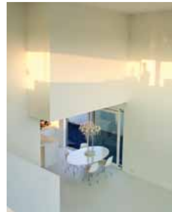
Villa Mattenbiesstraat - IJburg, Amsterdam