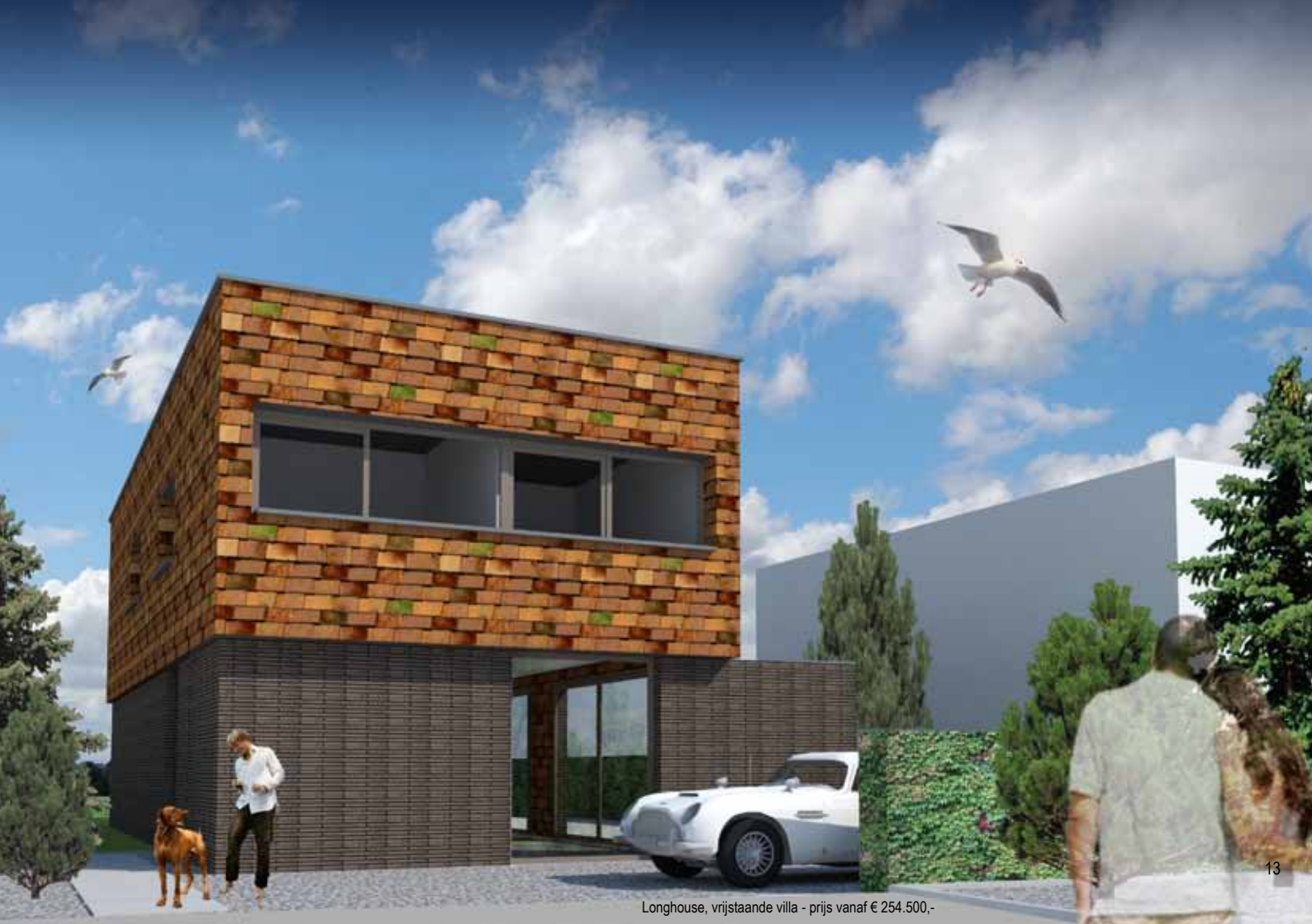
Longhouse, vrijstaande villa - prijs vanaf € 254.500,-