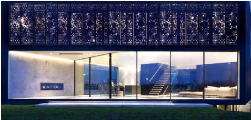
Kavel 01 - Rieteiland Oost, Amsterdam