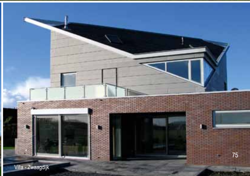
Villa - Zwaagdijk