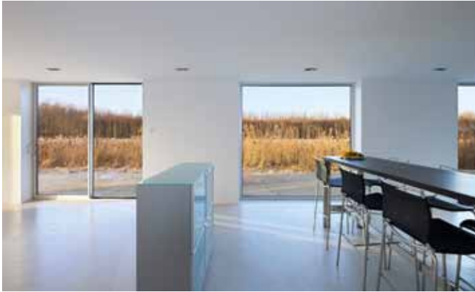
Villa Valk, balans tussen comfort en eenvoud