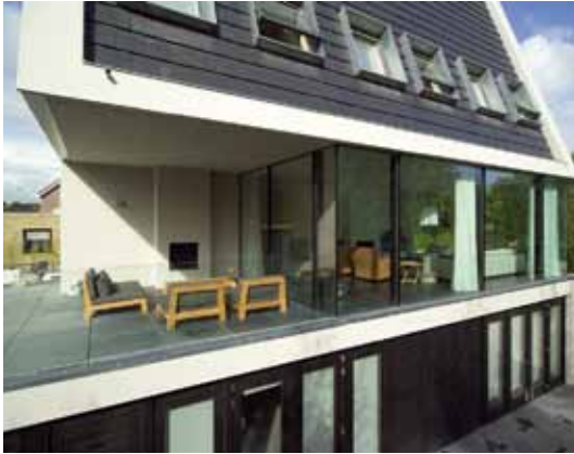
Villa JoJo - Waalwijk