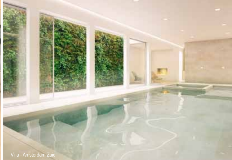
Villa - Amsterdam-Zuid