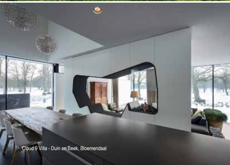
Cloud 9 Villa - Duin en Beek, Bloemendaal