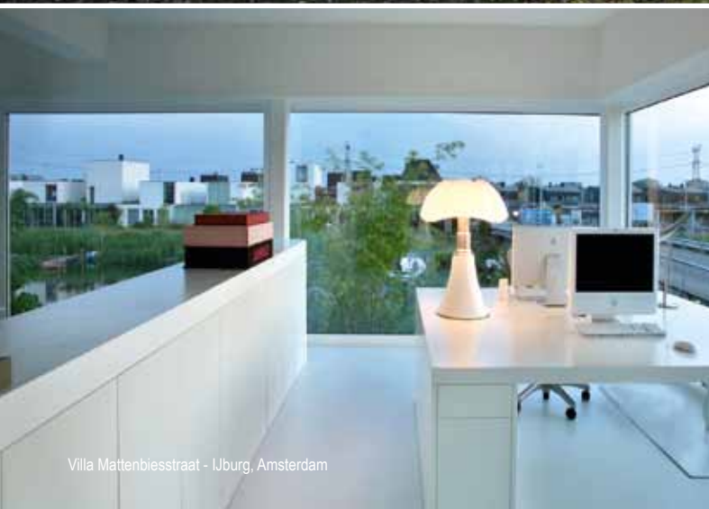
Villa Mattenbiesstraat - IJburg, Amsterdam