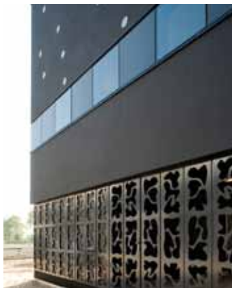
Woonhuis - Woerden