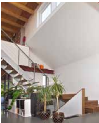
Woonhuis - Haarlem