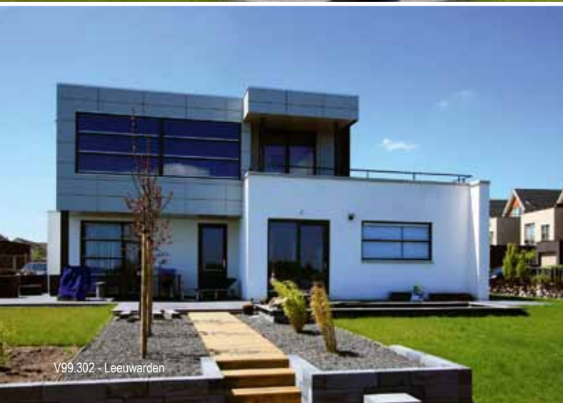
V99.302 - Leeuwarden