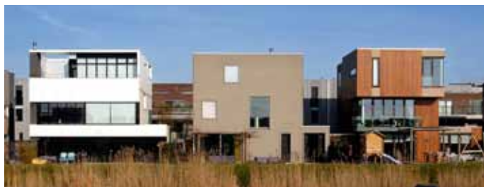
Villa's op IJburg door Konst & van Polen b.v. gebouwd