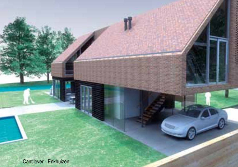
Cantilever - Enkhuizen