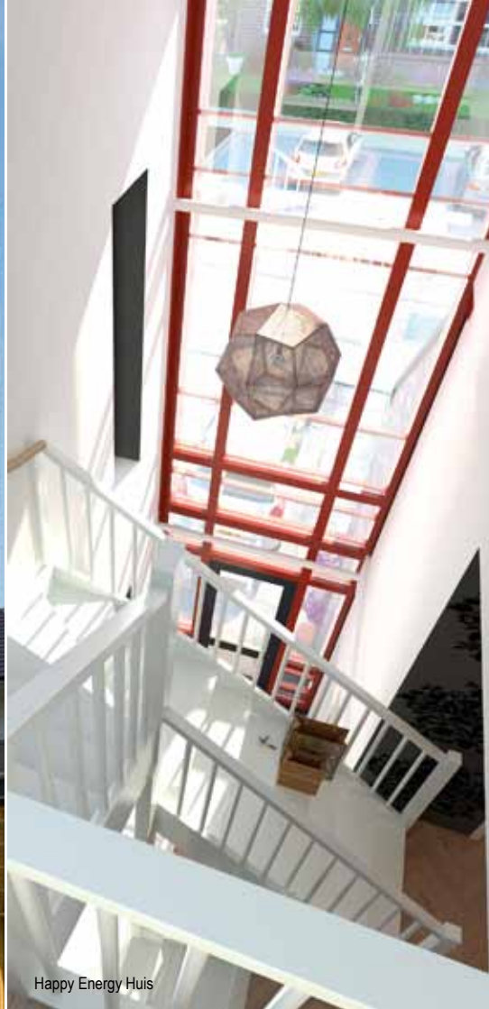
Happy Energy Huis