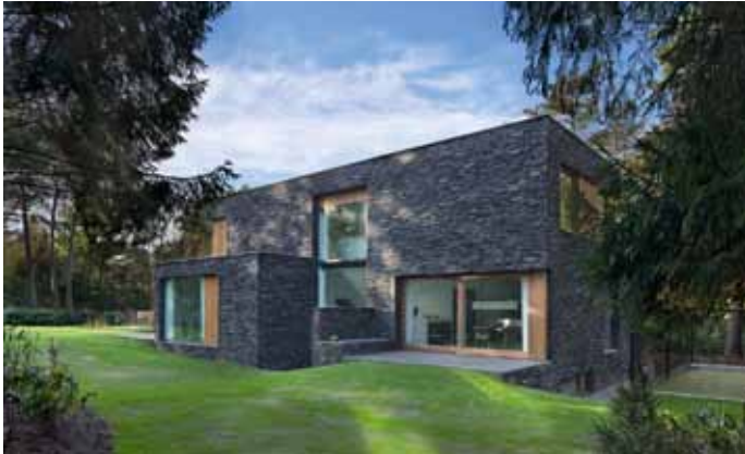
Bosvilla - Soest