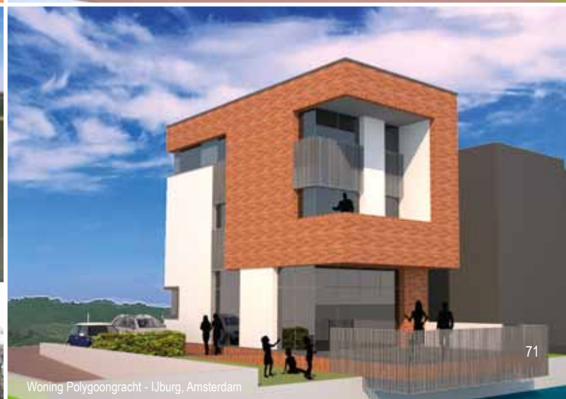
Woning Polygoongracht - IJburg, Amsterdam