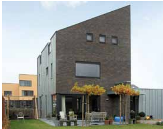
V99.409 - Eelderwolde