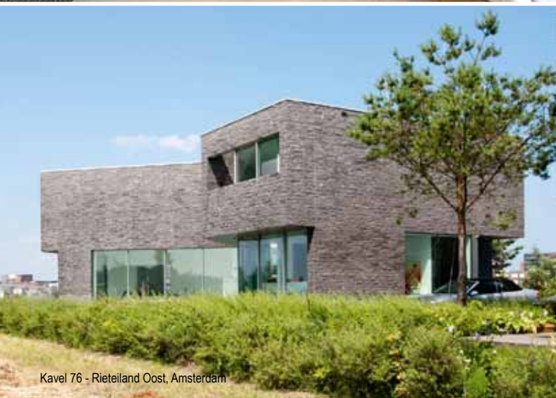
Kavel 76 - Rietveld Oost, Amsterdam