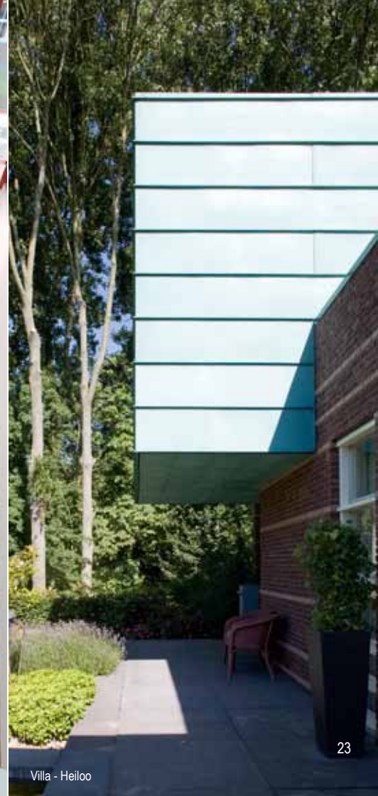
Villa - Heiloo