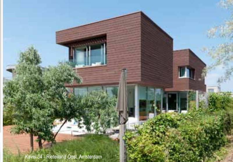
Kavel 34 - Rietveld Oost, Amsterdam