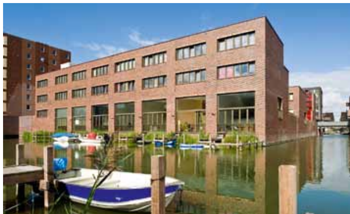
IJburg blok 62