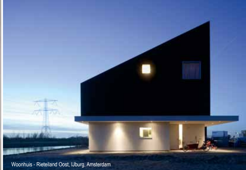
Woonhuis - Rietveld Oost, IJburg, Amsterdam