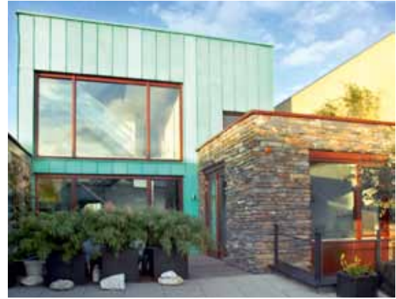
Rieteiland Oost, IJburg, Amsterdam