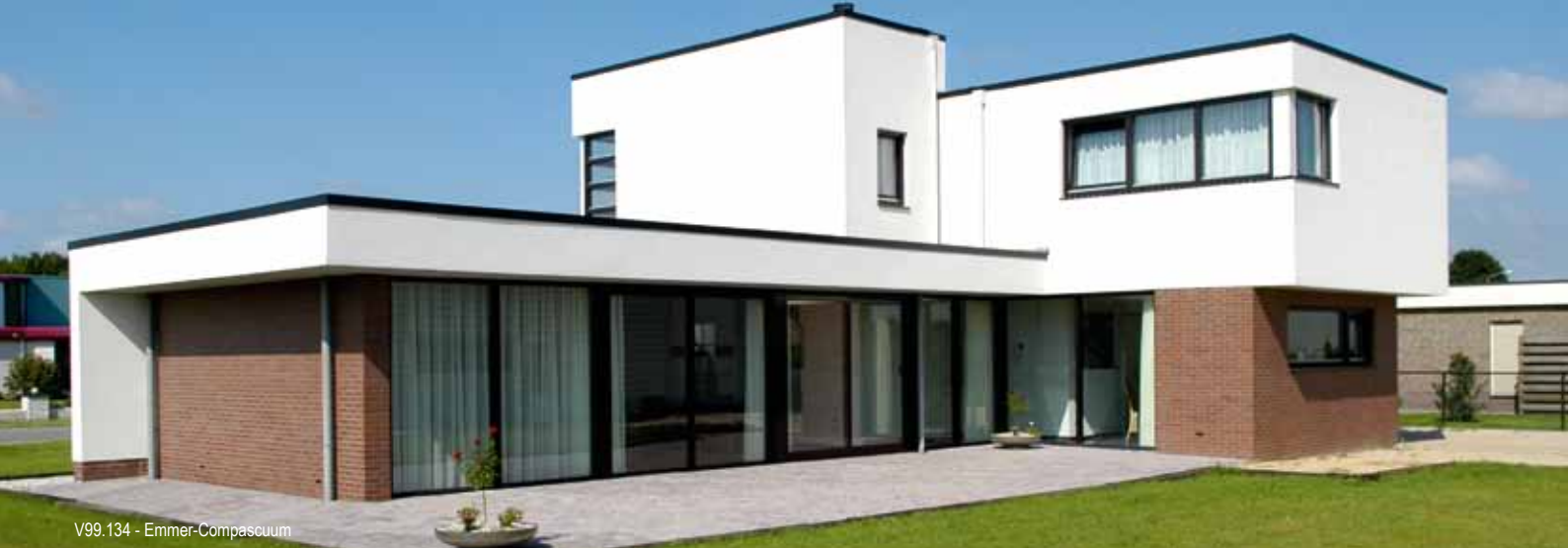
V99.134 - Emmer-Compascuum