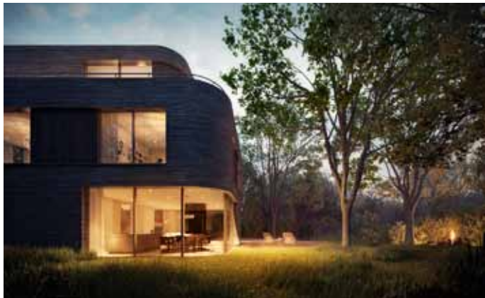
Villa - Bloemendaal 2