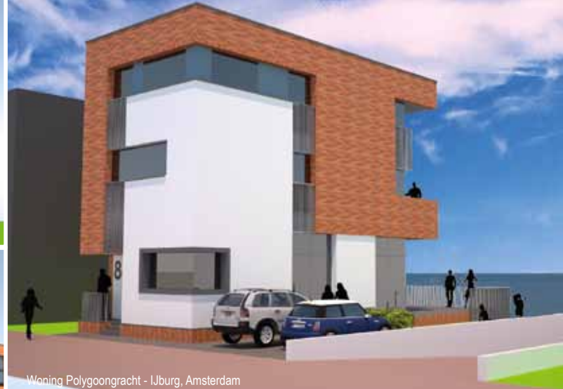
Woning Polygoongracht - IJburg, Amsterdam