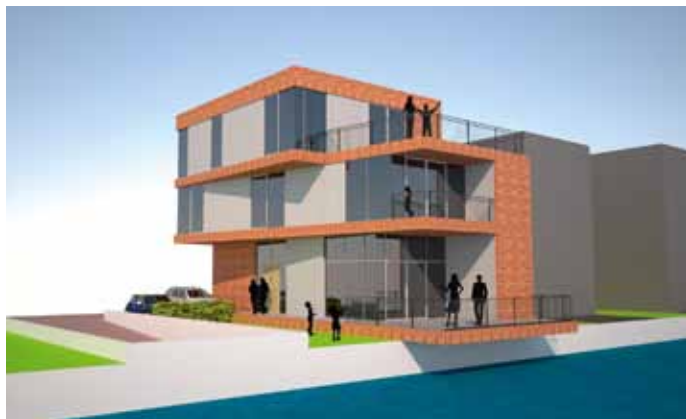
Villa Polygoongracht - IJburg, Amsterdam