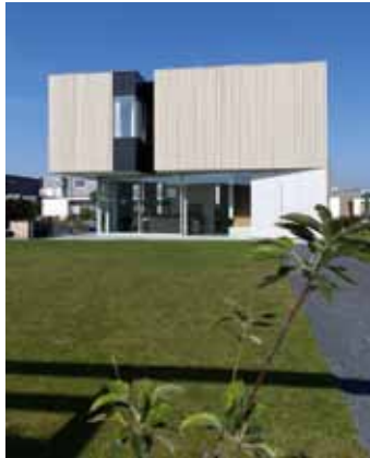
Woonhuis - Groningen