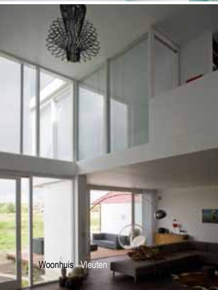
Woonhuis - Vleuten