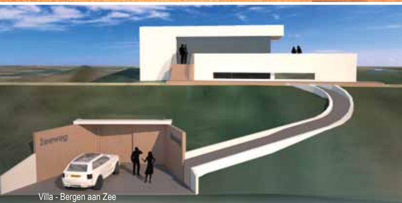
Villa - Bergen aan Zee