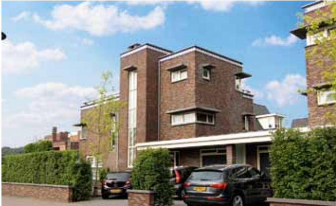
Villa - Oosterhout