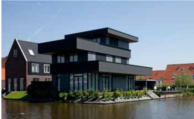
Villa Ypenburg 2 - Den Haag