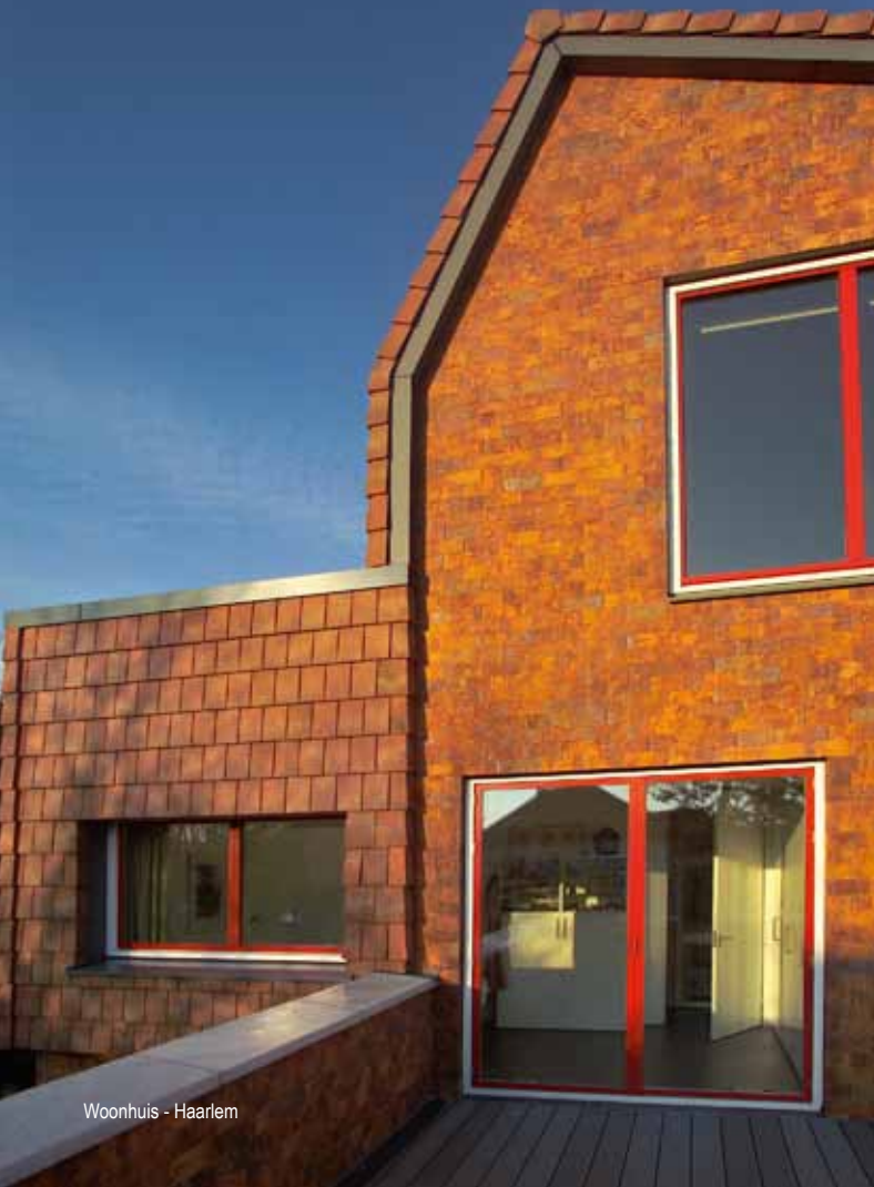
Woonhuis - Haarlem