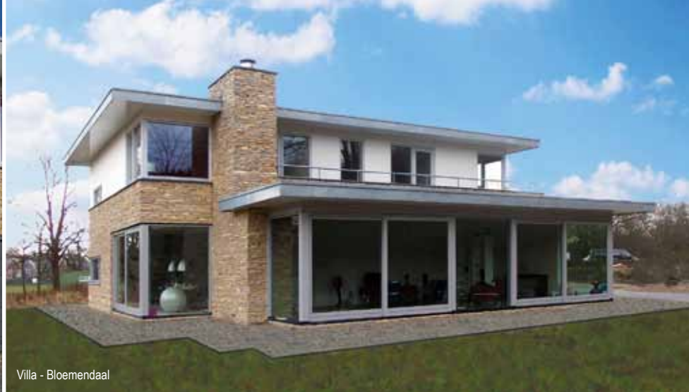
Villa - Bloemendaal