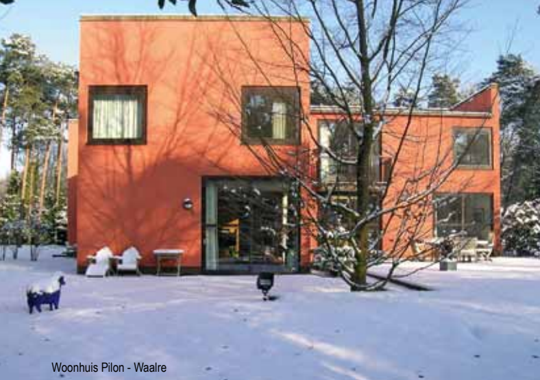
Woonhuis Pilon - Waalre