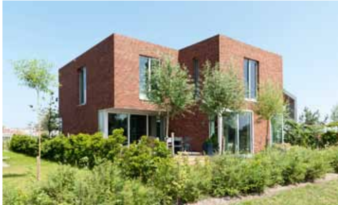
Kavel 76 - Rieteiland Oost, Amsterdam