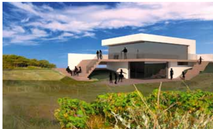
Villa - Bergen aan Zee