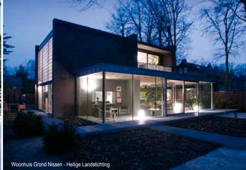
Woonhuis Grond Nissen - Heilige Landstichting