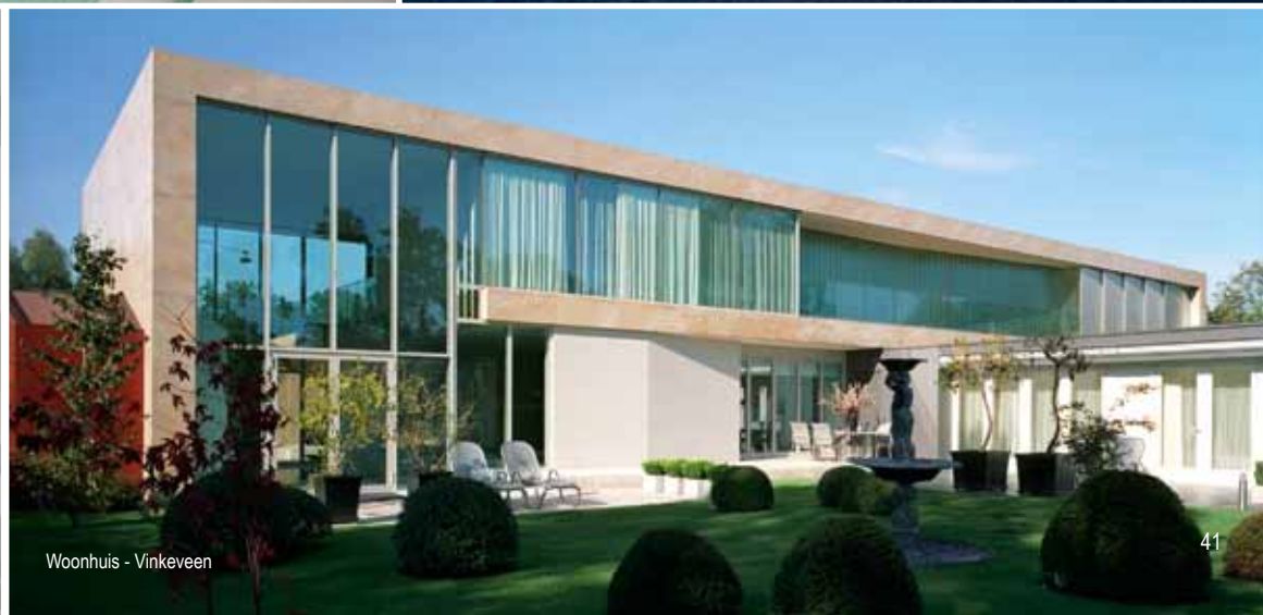
Woonhuis - Vinkeveen