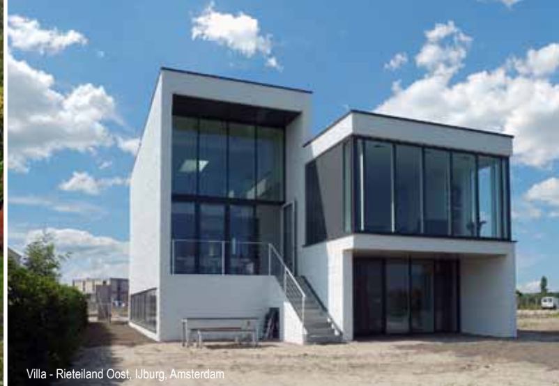
Villa - Rieteland Oost, IJburg, Amsterdam