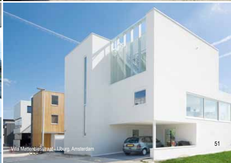
Villa Mattenbiesstraat - IJburg, Amsterdam