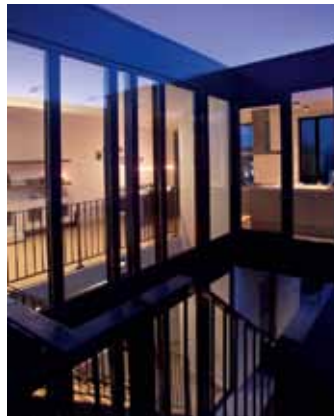
Flexcellence Lisdoddelaan - IJburg, Amsterdam