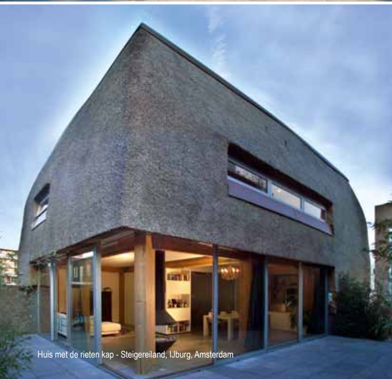
Huis met de rieten kap - Steigereiland, IJburg, Amsterdam