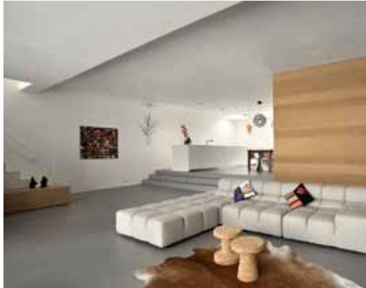
Villa - IJburg, Amsterdam