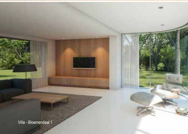
Villa - Bloemendaal 1