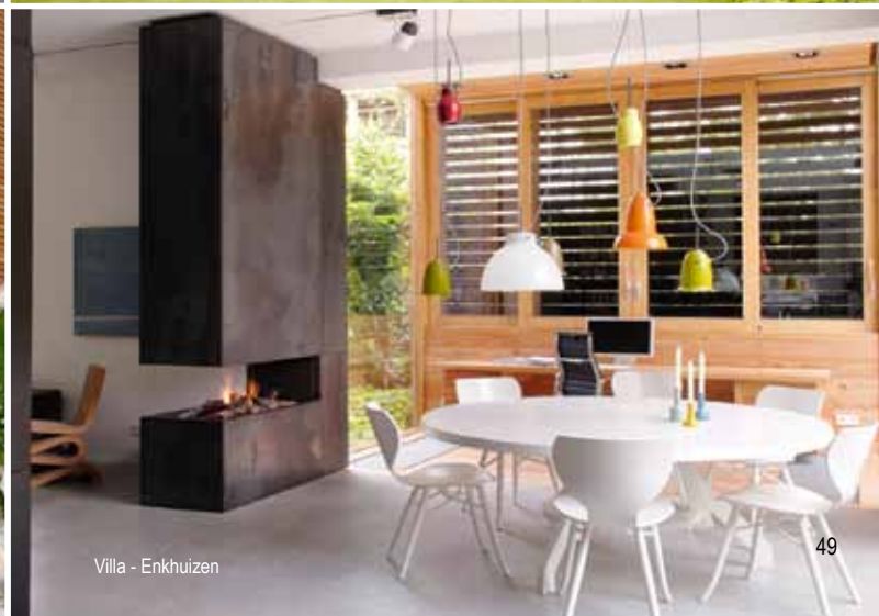
Villa - Enkhuizen