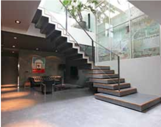
Nieuwe Herengracht - Amsterdam