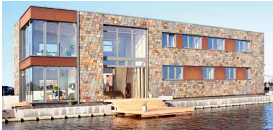
Woon-werkvilla - Noorderplassen